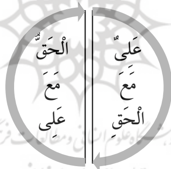
نمودار شماره ۴: قوس نزولی و صعودی عدل و فعل امام

«تَمَامُ الْأَمْرِ بِقَائِمِ آلِ مُحَمَّدٍ ﷺ؛ تمام امر به دست قائم آل محمد است» (صدوق، ۱۳۷۶، ص ۳۲۵). آنچه در دولت مهدوی دیده خواهد شد، تحقق عین عدالت است و شناخت محل عدالت نیز در فرایند علم امام و مقوله امامت حاصل خواهد شد؛ اما پرسش مهم این است که آیا امام مهدی ﷺ، عدالت در مسائل را کشف می‌کند و سپس به آن می‌پردازد یا اینکه هر آنچه ایشان انجام خواهد داد، عین عدالت است؟ به عبارتی، آیا فعل امام عدل است یا عدل امام فعل او است؟ به نظر می‌رسد، با دو مقوله (عدل - امام) و (عدالت - امامت) مواجه هستیم. مقوله اول در قوس نزولی، و مقوله دوم در قوس صعودی ملاحظه می‌شود. بر اساس این دیدگاه، امام در قوس نزولی خود، همان عدل است و در قوس صعودی، فعل امام عین عدل است و به عبارتی دیگر، امامتِ امام همان عدالت است و روایت پیامبر اکرم ﷺ به همین قوس اشاره دارد: «عَلَيْهِ مَعَ الْحَقِّ وَالْحَقُّ مَعَ عَلِيٍّ؛ علی با حق است و حق با علی» (خزعلی رازی، ۱۳۵۹، ص ۲۰).