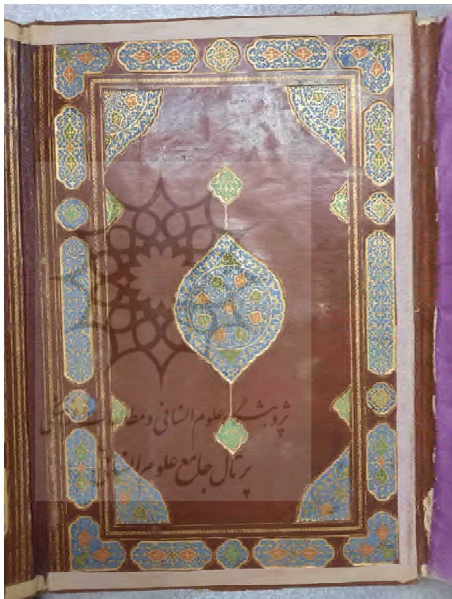
همان نسخه، داخل جلد، طبله دوم.

آینه پژوهش | ۲۱۴ سال ۳۶ | شماره ۴ مهر و آبان ۱۴۰۴