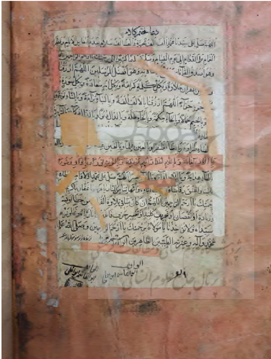
همان نسخه، دعای ختم قرآن احتمالاً به خط واقف با امضا و مهر او در پایین، صفحه خاتمه.