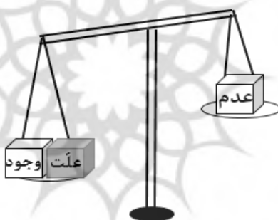
ترجیح در ممکن الوجود

موجودات همواره تمایل به بهتر دارند، بنابراین میان وجود و عدم همواره میل و کشش آن‌ها به سمت وجود یافتن است. بنابراین با پیدایش علت، ابن‌سینا سنگینی را به طرف کفه وجود سوق می‌دهد نه کفه عدم.