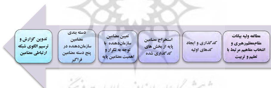
شکل شماره ۱: مراحل پژوهش

الگوی پیشنهادی براون و کلارک (۲۰۰۶) از سه مرحله و شش گام تشکیل شده است. در مرحله اول آشنایی با متن، کدگذاری و ایجاد کدهای اولیه و در نهایت جستجو و شناخت مضامین انجام می‌شود. در مرحله دوم به ترسیم نقشه شبکه مضامین پرداخته می‌شود. در مرحله نهایی تحلیل شبکه مضامین و ترسیم شبکه مضامین انجام می‌شود. مهم‌ترین اقدام در این مرحله شناخت مقوله‌های فراگیر، سازمان‌دهنده و مضامین پایه است. بر همین اساس بررسی کیفی و استخراج مضامین از بیانات رهبری، طبق مراحل شکل ۱ انجام شده است. در مرحله اول ۴۰۳ مورد از بیانات مقام معظم رهبری مرتبط با مبحث تعلیم و تربیت انتخاب شد. پس از مطالعه چندباره متن و تفکیک متن به بخش‌های کوچک‌تر، کدهای اولیه ایجاد و کدگذاری به شیوه دستی صورت گرفت. سپس مضامین مرتبط با تعلیم و تربیت از بخش‌های کدگذاری شده، از این بیانات استخراج و مضامین مشابه در قالب مضامین پایه دسته‌بندی شد. برای تکمیل مطالب این مرحله، ۸۸ مورد دیگر از بیانات مورد مطالعه و بررسی قرار گرفت. سپس تعداد ۶۶ مضمون پایه در ۱۱ مضمون سازمان‌دهنده دسته‌بندی شدند و در آخر مضامین سازمان‌دهنده در قالب ۵ مضمون فراگیر قرار گرفتند.