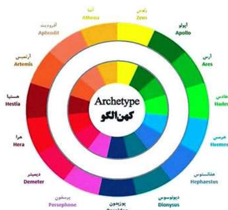
شکل (۲): آرکی تایپ‌های یونگ.