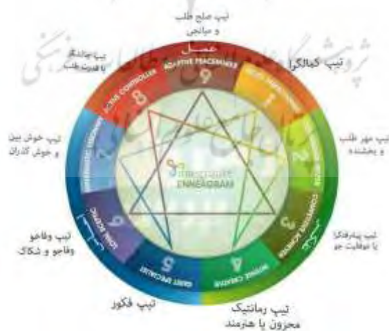
شکل (۱): تیپ‌های انیاگرام.