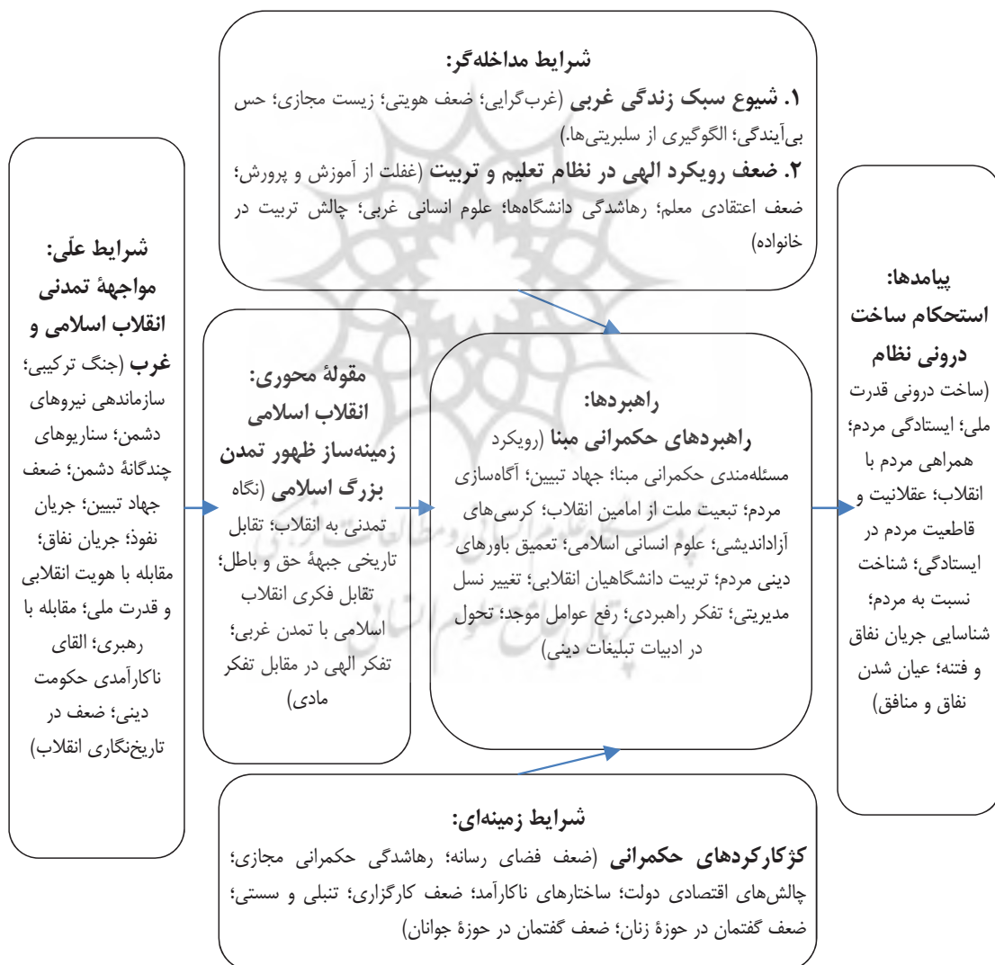
شکل ۲. مدل پارادایمی تحلیل اغتشاشات پاییز ۱۴۰۱ با رویکرد تمدنی

در این پژوهش تلاش شد با اتخاذ رویکرد تمدنی به تحلیل فتنه زن، زندگی و آزادی پرداخته شود. در نهایت مدل پارادایمی تحلیل اغتشاشات پاییز ۱۴۰۱ در شکل ۲ به تصویر کشیده شده است.