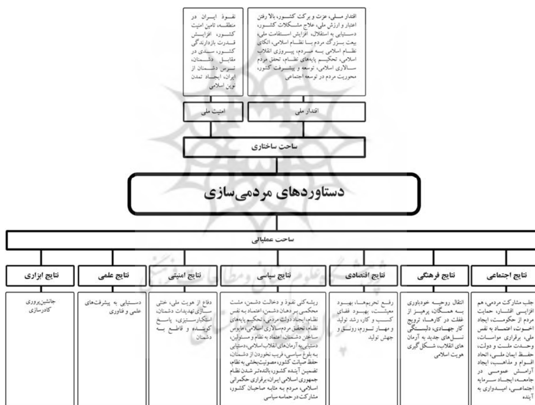
شکل ۲. مدل مفهومی دستاوردهای مردمی‌سازی در منظومه فکری مقام معظم رهبری

ملی و بهبود معیشت از جمله نتایج عملیاتی هستند که به سرعت در جامعه قابل مشاهده‌اند. این تقسیم‌بندی امکان تحلیل جامع‌تری از دستاوردهای مردمی‌سازی را فراهم می‌آورد. در مجموع، سطح ساختاری به بررسی ابعاد کلان و تأثیرات عمیق‌تر می‌پردازد، و به ما کمک می‌کند تا درک بهتری از تأثیرات کلان و بلندمدت مشارکت مردم در نظام جمهوری اسلامی پیدا نماییم. این سطح به ما این امکان را می‌دهد که نتایج ساختاری و بین‌المللی را بررسی کرده و نشان دهیم که چگونه این نتایج می‌توانند به تقویت نظام کمک کنند. از سوی دیگر، سطح عملیاتی بر جنبه‌های روزمره و ملموس‌تر تأکید دارد و نشان می‌دهد که چگونه مشارکت مردم در حوزه‌های اجتماعی، فرهنگی، اقتصادی، سیاسی و امنیتی می‌تواند به بهبود شرایط زندگی و تقویت نظام یاری رساند.