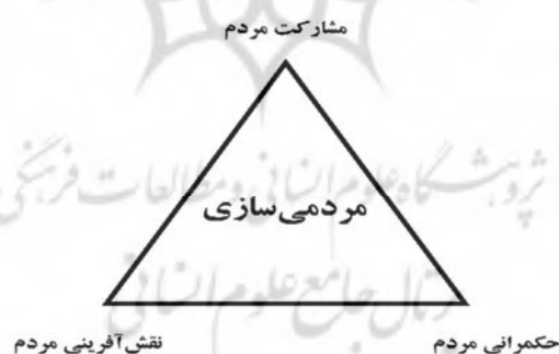
شکل ۱. سه ضلع تحقق دستاوردهای مردم‌سازی

که بر نحوه تعامل دولت‌ها و سایر سازمان‌های اجتماعی با یکدیگر، نحوه ارتباط با شهروندان و نحوه اتخاذ تصمیمات در جهانی پیچیده تمرکز داشته و فرایندی است که از آن طریق جوامع و سازمان‌ها تصمیمات خود را اتخاذ و به واسطه آن، مشخص می‌کنند که چه کسانی در این فرایند درگیر و چگونه وظیفه خود را به انجام برسانند. در واقع حکمرانی به سازمان‌ها و افرادی می‌پردازد که در فرایند تصمیم‌گیری و اجرای تصمیمات نقش دارند و لازم به توجه است که حکمرانی، وجود قدرت در داخل و خارج از اقتدار نهادهای رسمی و غیررسمی را به رسمیت می‌شناسد و گروه‌های اصلی از بازیگران دولتی، بخش خصوصی و جامعه مدنی را شامل و نیز دربرگیرنده فرایند شناسایی و تشخیص تصمیماتی است که در آن مجموعه پایه‌ریزی شده‌اند» (براون، ۱ ۲۰۱۸: ۲۷). به‌طورکلی، حکمرانی مردم و مردم‌سازی دو مفهوم متقابل هستند که به هم پیوند داده شده‌اند و به تعامل بین مردم و دولت و نهادهای سیاسی اشاره دارند. حکمرانی مردمی نیاز به مردم‌سازی دارد تا مردم بتوانند به طور فعال در فرایندهای تصمیم‌گیری شرکت کنند. مردم‌سازی نیز به حکمرانی مردمی نیاز دارد تا مردم بتوانند در تصمیم‌گیری‌های سیاسی و اجتماعی مشارکت فعال داشته باشند. به‌طورکلی، حکمرانی مردمی و مردم‌سازی به عنوان دو مفهوم متقابل و تعاملی در سیاست و جامعه، با هم ارتباط نزدیکی دارند و هدف آنها توسعه مشارکت‌پذیری مردم در تصمیم‌گیری‌های سیاسی و اجتماعی و تقویت مردم‌سالاری است (فیشر، ۲ ۲۰۱۷: برنامه توسعه سازمان ملل متحد، ۳ ۲۰۲۰).