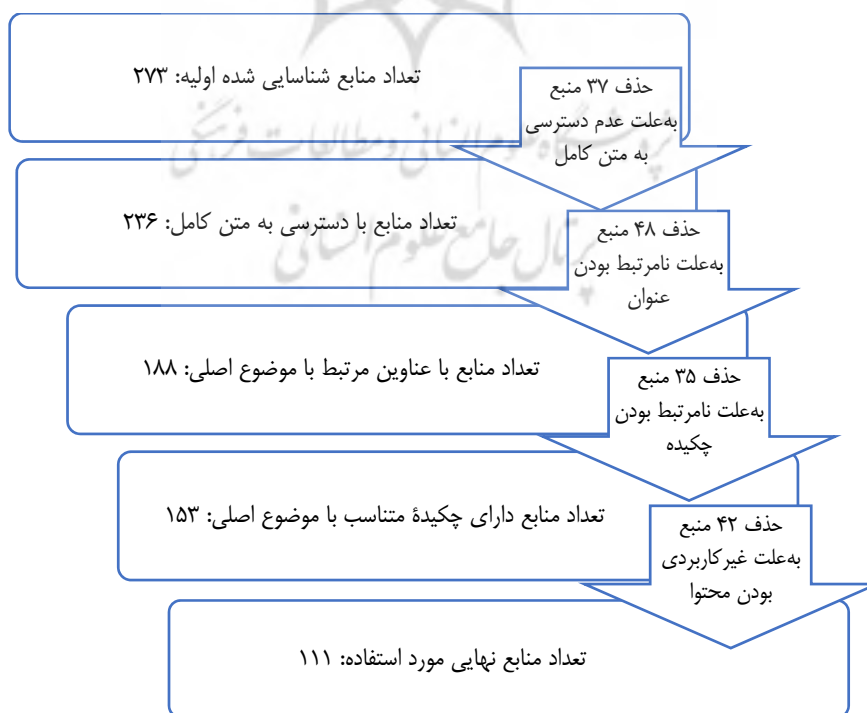
شکل ۲. فرایند شناسایی، ارزیابی و انتخاب منابع مورد استفاده

طی جست‌وجوی کلیدواژه‌ها در پایگاه‌های اطلاعاتی، ۲۷۳ اثر پژوهشی یافت شد. سپس عنوان، چکیده و محتوای هریک از این آثار، مطابق با هدف و سؤال‌های پژوهش بررسی و در نهایت، ۱۱۱ منبع برای استفاده در پژوهش انتخاب شد (۶۵ منبع، مورد استفاده در متن مقاله و جدول‌های ۳ و ۴ و الباقی منابع مورد استفاده صرفاً در متن مقاله). شکل ۲ فرایند شناسایی، ارزیابی و انتخاب منابع نهایی مورد استفاده را نشان می‌دهد.