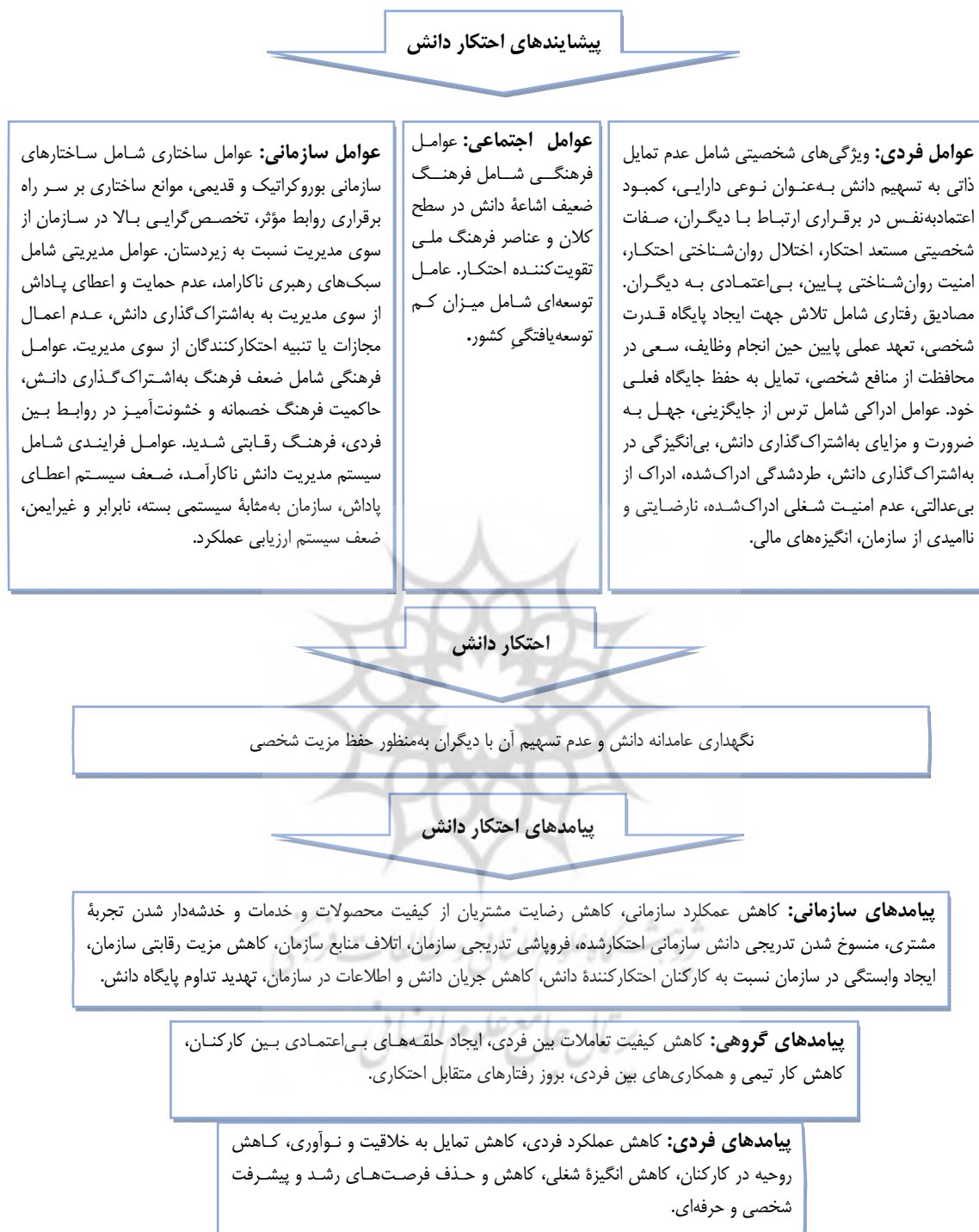
شکل ۳. الگوی پیشایندها و پیامدهای اختکار دانش

شکل ۳، الگوی نهایی منتج از پژوهش حاضر می‌باشد. همانطور که در شکل مزبور گزارش شده است، پیشایندهایی نظیر عوامل فردی، عوامل سازمانی و عوامل اجتماعی، منجر به بروز پدیده اختکار دانش در سازمان‌ها می‌گردند و بروز پدیده مزبور، آثار و پیامدهایی را در قالب پیامدهای فردی، گروهی و سازمانی به همراه خواهد داشت.