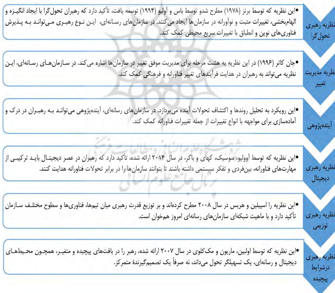
شکل ۱. چارچوب نظری پژوهش

این بخش به تحلیل نظریه‌های مرتبط و بررسی پژوهش‌های گذشته می‌پردازد تا چارچوبی منسجم برای درک و مدیریت رهبری در سازمان‌های رسانه‌ای با توجه به تحولات فناورانه ارائه دهد.