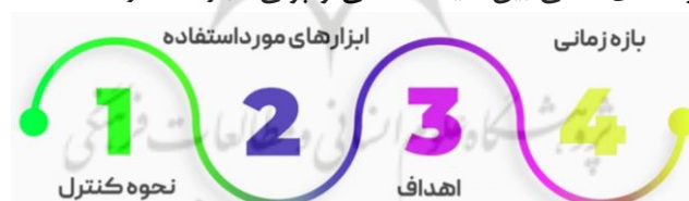
شکل (۴): تفاوت سیاست پولی و مالی

سیاست‌های مالی و پولی دو ابزار متفاوتی هستند که توسط دولت‌ها و بانک‌های مرکزی برای تأثیرگذاری بر اقتصاد مورداستفاده قرار می‌گیرند. تفاوت‌های اصلی بین سیاست مالی و پولی عبارت‌اند از: