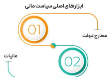
شکل (۳): ابزارهای اصلی سیاست مالی