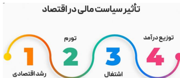
شکل (۱): تأثیر سیاست مالی در اقتصاد