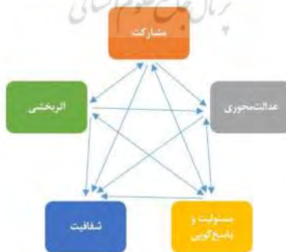
شکل (۳): مدل ساختاری پژوهش