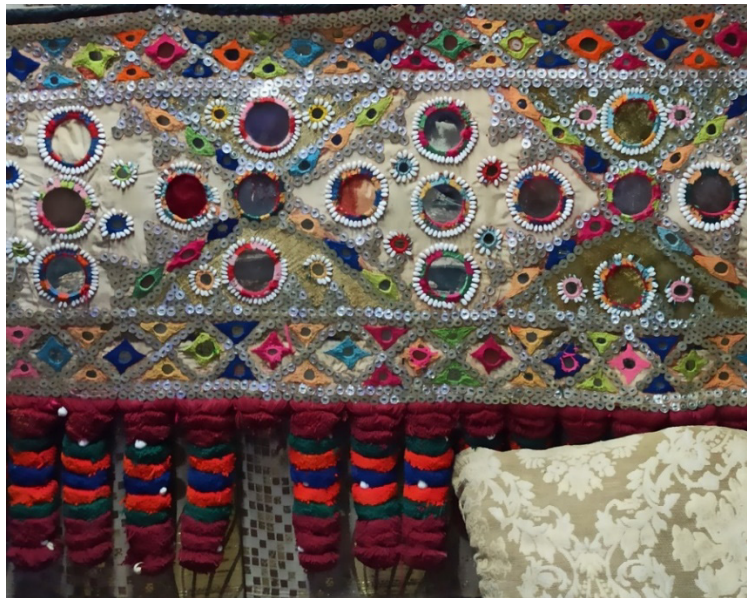
شکل ۶: سکه دوزی بلوچستان، (Noori, 2022)

رنگ زمینه به صورت رنگ سبز روشن و صورتی (گل بهی) انتخاب شده است که به مرور زمان، رنگ‌های مخمل از بین رفته‌اند و فقط در نقاطی محدود مشاهده می‌شوند و تنها زمینه کرم رنگی از زمینه بافت مخملی به جای مانده است. وجود رنگ سبز به عنوان رنگ اصلی، سبب درخشش رنگ‌های دیگر شده است. طیف رنگ‌های سبز روشن در سوزن دوزی‌های زمینه نیز مشاهده می‌شود. در ریشه‌ها، سبز تیره بیانی از تداوم و اعتبار را تداعی می‌کند. نارنجی مخمل زمینه در ملایم‌ترین حالت به کار گرفته شده است و نشان از رنگ گل بهی دارد. ترکیب رنگی فراوان در تمامی اثر قابل مشاهده است. در اطراف آینه‌ها، نخ‌های قاب دوزی نیز به صورت ترکیبی از رنگ‌های مختلف دیده می‌شود. وجود رنگ آبی در زمینه، حاشیه و ریشه‌ها به صورت کهرنگ و پر رنگ، احساسی از آرامش را در تمام سکه دوزی نمایان می‌سازد. وجود رنگ صورتی که در اطراف برخی ریز آینه‌ها سوزن دوزی شده است، نوعی مؤنث بودن و زنانگی را بیان می‌کند. در کنار آن، رنگ‌هایی چون نارنجی و قرمز مشاهده می‌شود. نارنجی نیز مانند قرمز سرخی آتش را نشان می‌دهد و در بیان، به عشق و شادی می‌پردازد. قرمز همانند نمونه‌های قبلی به صورت پر کاربردترین رنگ در هنر سکه دوزی پدیدار می‌شود و در ریشه‌های اثر نیز قابل مشاهده است. رنگ جدیدی همانند قهوه‌ای روشن و خردلی در این نمونه وجود دارد که در نمونه‌های قبلی مشاهده نمی‌شود.