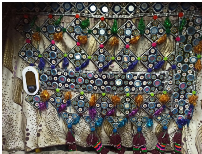
شکل ۳: سکه چلچوک، (Noori, 2022)