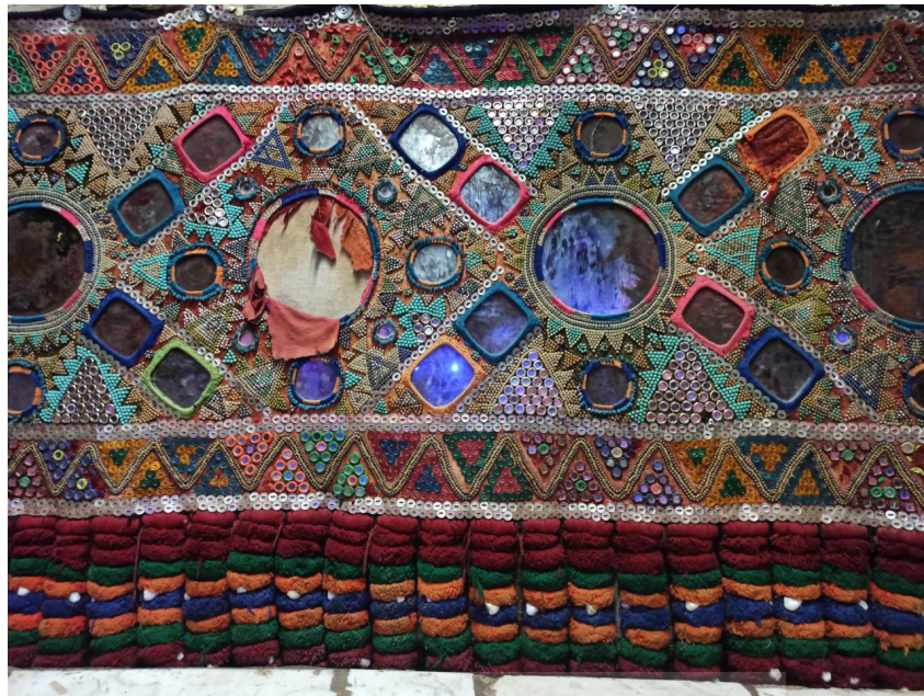
شکل ۲: سکه‌دوزی بلوچستان، (Noori, 2022)

در (شکل ۲)، سکه‌ای را مشاهده می‌کنیم که مربوط به بخش جنوبی بلوچستان، منطقه مکران است. تولید اثر مربوط به دهه ۱۳۴۰ ه.ش است. جل یا زمینه اصلی، ترکیب بزرگ‌تری نسبت به ریشه‌ها دارد. در این نمونه، استفاده از سکه جایگاه کم‌تری در کار دارد و مرواریدهای رنگی بخش بیشتری از تزیینات را تشکیل داده است. استفاده از فلز در این نمونه مشاهده می‌شود که همانند قابی اطراف ریز آینه‌ها را دربر گرفته است. طرح و نقش در این نمونه، از سکه‌دوزی تحت تأثیر فرهنگ و هنر هندوستان است و دلیل آن نزدیکی منطقه مکران به هندوستان است. در زمینه اصلی، وجود آینه‌های گرد بزرگ را مشاهده می‌کنیم که اطراف آن با آینه‌های کوچک در دو سایز مختلف تزیین شده است. آینه‌های مربع در نقوش زمینه قابل مشاهده است. اطراف تخته اصلی، دو حاشیه یکی در بالا و دیگری در پایین تزیین شده است. خطوط اصلی حاشیه با سکه (دکمه‌های صدفی) تزیین شده و طرح حاشیه‌ها طرح‌های چوتل و مثلثی هستند که توسط دکمه‌ها و مرواریدهای رنگی شکل گرفته است. نقوشی چون دایره، مربع، لوزی و مثلث تمامی طرح‌ها و نقش‌های سکه را تشکیل داده است. وجود پلک‌های یک‌دست و قرینه در انتهای اثر را که به حاشیه پایینی متصل شده‌اند، مشاهده می‌کنیم. کچک‌های بزرگ در لابه‌لای پلک‌های مшти به سکه زیبایی بیشتری می‌بخشد.