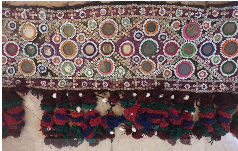
شکل ۱: سکه‌دوزی بلوچستان، (Noori, 2022)