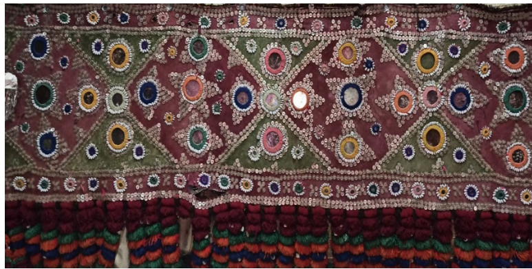
شکل ۵: سکه پنج آینه‌ای، (Noori, 2022)