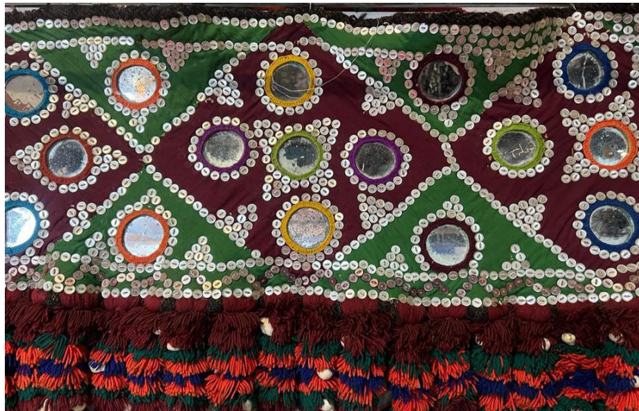
شکل ۴: سکه‌دوزی بلوچستان، (Noori, 2022)