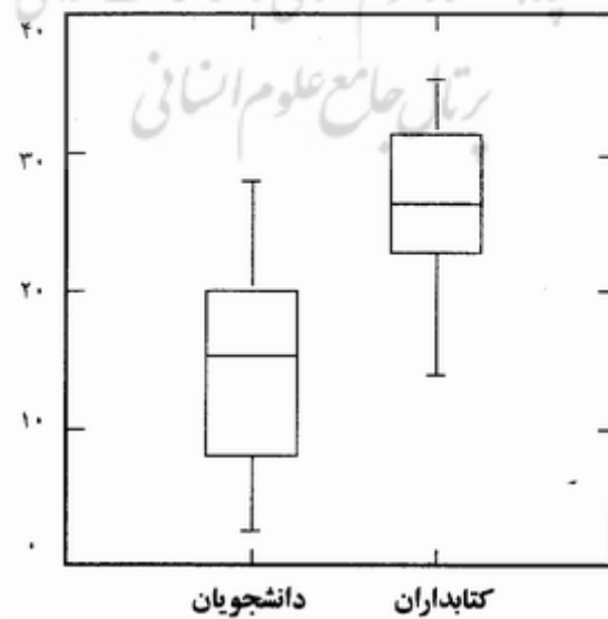
شکل ۳ - دامنه و متوسط نمرات قیاس کلامی دانشجویان و کتابداران