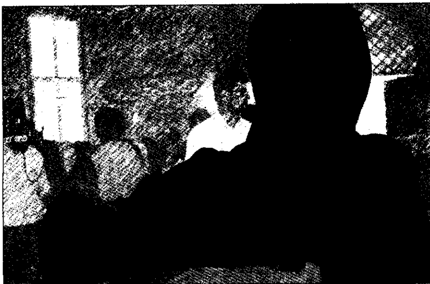
جدول شماره ۱

اگرچه حزب مشارکت تنها حزبی است که به طور رسمی حمایت از زنان را در دستور کار خود قرار داده و علاوه بر به کارگیری زنان در سطوح حزبی، قائل به سهمیه بندی (سهمیه ۳۰ درصدی) به نفع زنان است، اما هنوز راه زیادی باقی است تا شعارها عملی شود و هنوز نتوانسته یا نخواسته است حداقل به شعارهای حزبی خود جامه عمل بپوشاند. شاید بتوان گفت: یکی