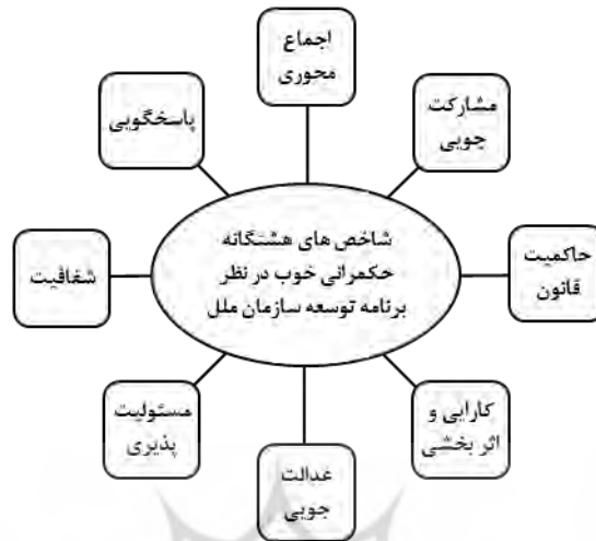
شکل ۱. اصول هشتگانه حکمرانی خوب از منظر برنامه توسعه سازمان ملل متحد