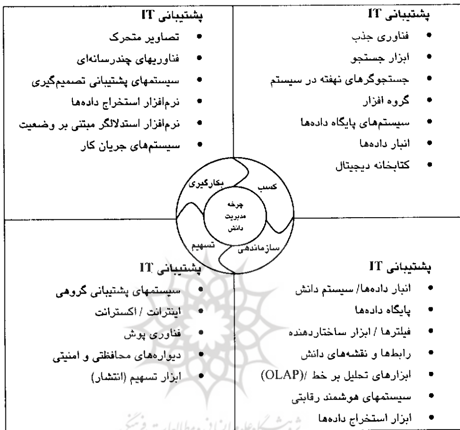
شکل ۳- پشتیبانی فناوری اطلاعات از مدیریت دانش

سخن آخر اینکه، گرچه جوهره و موتور محرک سازمان دانش محور، فناوری اطلاعات است و بیشترین سهم را در اجرای فرایند مدیریت دانش دارد، لیکن مدیران باید به این نکته توجه داشته باشند که اجرای مدیریت دانش به کمک فناوری اطلاعات در صورتی موفقیت‌آمیز خواهد بود که قبل از اجرا، فرهنگ‌سازی شود و کارکنان نیز به استفاده از رویکرد مدیریت دانش تشویق شوند.