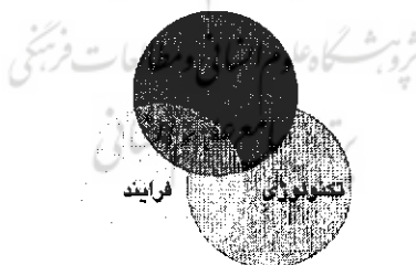
شکل ۱- رابطه‌ی بین افراد فرایند و تکنولوژی

داده‌هایی هستند که برای انجام کارها به کار می‌روند. در این صورت، انسانها و نه کامپیوترها صاحب دانش محسوب می‌شوند (فایرستون و ایلروی ۱ ، ۲۰۰۵: ۲۴). فناوری اطلاعات برای انجام اعمال ساده‌ای مثل هماهنگی بین انسان و اعمالش مفید است و با فرایندهای ایجاد و ترکیب دانش تفاوت دارد. در فرآیند مدیریت اطلاعات ارزیابی وجود ندارد، بنابراین تشخیص دانش درست یا غلط امکان‌پذیر نیست. تولید اطلاعات، شامل کسب اطلاعات، آموزش فردی، گروهی و حتی فرمول‌نویسی است ولی در آن ارزیابی وجود ندارد. بنابراین در مقایسه با سیکل دانش، سیکل اطلاعات کامل نیست (شر ۲ ، ۲۰۰۴: ۲۱۱). این تصور که می‌توان بدون انجام کار زیاد، بدون تمرین و با استفاده از کامپیوتر به کسب دانش، تسهیم دانش و ... پرداخت، غلط است. ریشه این سوءتفاهم نیز به تأکید بیش از حد به فناوری اطلاعات در فرآیند مدیریت دانش و عدم تأکید بر رابطه‌ی متقابل بین کاربر و فناوری اطلاعات در توسعه‌ی دانش برمی‌گردد. اندرسون ۳ معتقد است تعامل صحیح بین افراد، تکنولوژی و فرایندهای سازمانی است که مدیریت دانش را به موفقیت می‌رساند (شکل شماره ۱). تأکید بیش از حد بر یک عامل و غافل شدن از عاملی دیگر فرآیند مدیریت دانش را دچار مشکل می‌سازد (اندرسون، ۲۰۰۵: ۱۱۹).