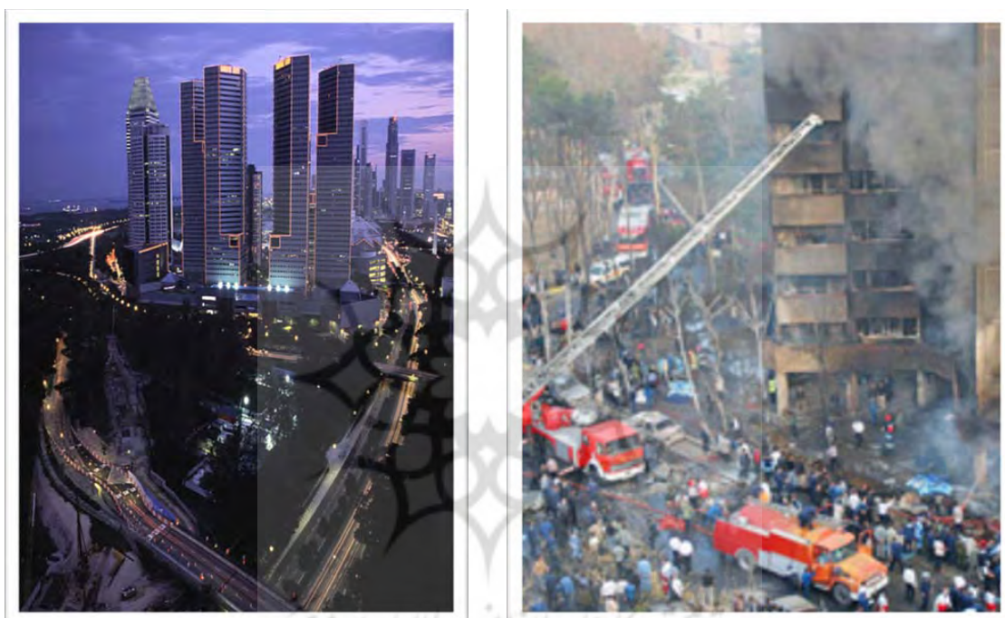
تصویر ۲ و ۳- تراکم جمعیت و تراکم اندیشه در کلان‌شهرها

(شهر دیروزی - شهر امروزی) را از هم جدا می‌کند و مهم‌تر از همه در این گونه از شهرها الگوهای مشابه جدایی‌گزینی اجتماعی، اقتصادی، و مکانی نیز تقویت می‌شوند (دیوید دراکاسیس، ۱۳۷۷، ۲۸). قسمت بومی شهر جهان سومی، از هیچ طرح و نقشه شهری تبعیت نمی‌کند و هیچ گونه اصول شهرسازی در آنها رعایت نشده است. کوچه‌ها و خیابان‌ها تنگ، تراکم جمعیت زیاد در بیشتر موارد این منطقه چسبیده به آلونک‌نشین‌ها می‌باشد (شکویی، ۱۳۷۲، ۹۱). در مقابل در قسمت پیشرفته شهر دفاتر شرکت‌های چند ملیتی، سازمان‌های تجارت جهانی، سازمان‌های غیر دولتی، بانک‌ها و غیره قرار دارند (پهکش، ۱۳۸۴، ۳۲۹-۳۳۳).