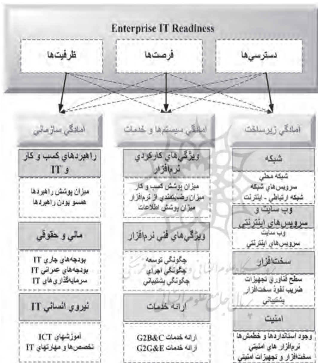
شکل (شماره ۲): مدل ارزیابی آمادگی الکترونیکی شهرداری اصفهان