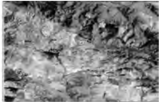
نقشه شماره ۱ موقعیت شهر جدید پردیس

۲۰۰۰هکتار میباشد. در نقشه شماره ۱ موقعیت، طرح تفصیلی و کاربری‌های شهر پردیس ارائه شده است. محیط فیزیکی شهر با توجه به قرار گرفتن در فاصله بین کوه و دشت از تنوع بالای میکروکلیمایی، توپوگرافی و سیستم هیدرولوژی برخوردار و در نتیجه باعث غنای محیط بیولوژیکی (فون و فلور) شده است.