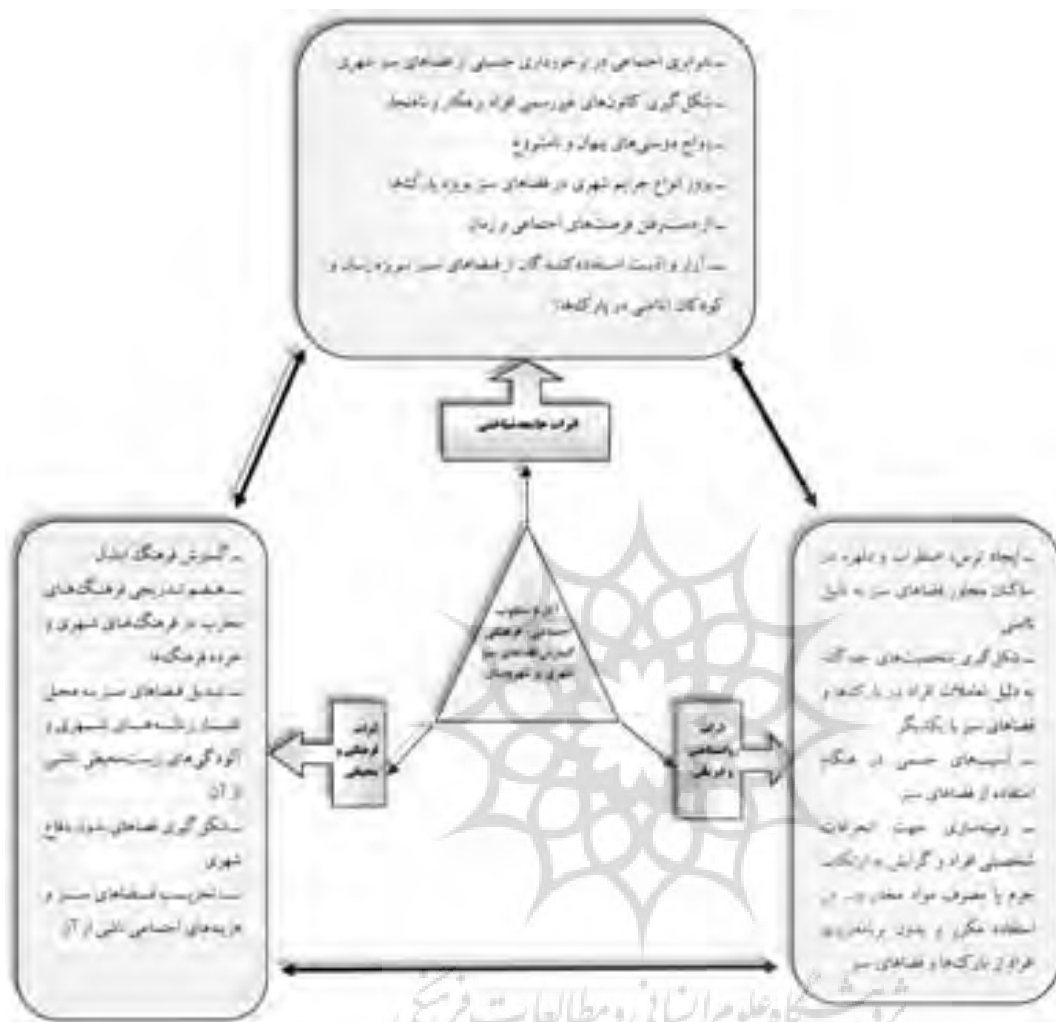
(شکل شماره ۲) آثار و پیامدهای نامطلوب ناشی از گسترش فضاهای سبز شهری بر ساختارهای اجتماعی، فرهنگی و ...

آثار نامطلوب جامعه‌شناختی، فرهنگی و روان‌شناختی گسترش فضاهای سبز شهری بر روی شهروندان را می‌توان به صورت شکل زیر نشان داد.