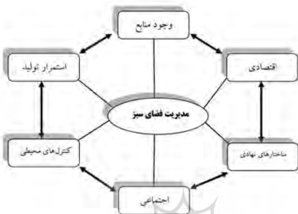
(نمودار شماره ۱) فرایند مدیریت توسعه پایدار در فضاهای سبز