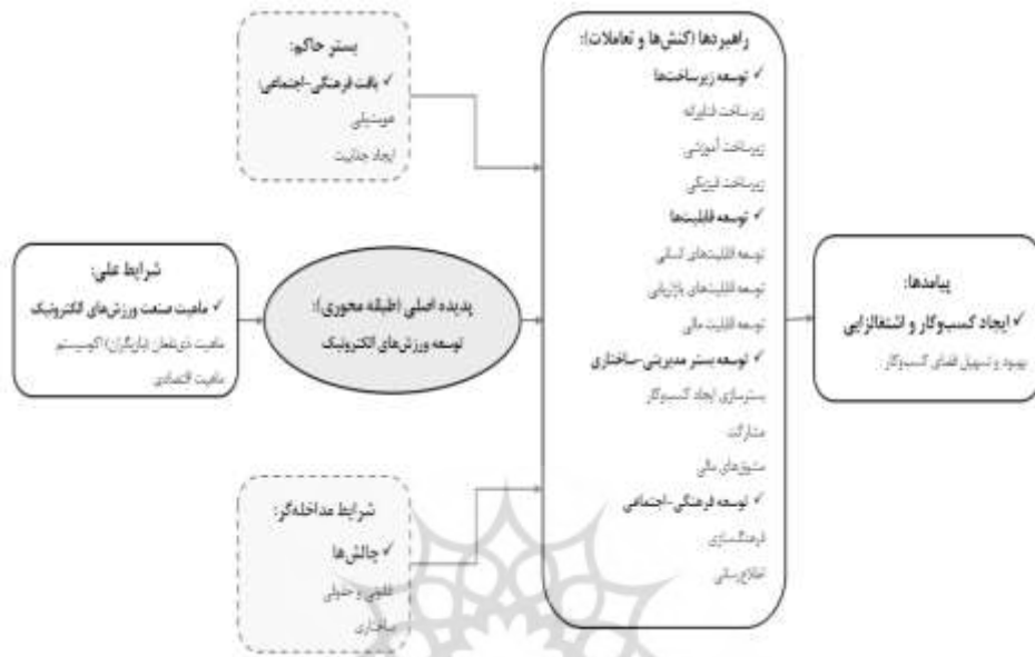
شکل ۲. الگوی پارادایمی پژوهشی

می‌دهد، ارتباط آن‌ها را بیان می‌کند و مقوله‌هایی که احتیاج به بهبود و بازنگری دارند را اصلاح می‌کند. در حقیقت، محقق تلاش می‌کند تا با