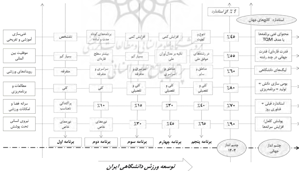
شکل ۳. مقایسه شاخص‌های بین‌المللی در توسعه ورزش دانشگاهی ایران براساس برنامه‌های کلان توسعه کشور

شاخص‌های بین‌المللی توسعه ورزش دانشگاهی از مطالعات راهبردی فدراسیون جهانی فیزو وبسایت این سازمان استخراج شده است وضعیت آن‌ها در توسعه ورزش دانشگاهی کشور براساس اسناد و گزارش‌های اداره کل تربیت‌بدنی وزارت علوم مورد بررسی قرار گرفته است (شکل ۳). همچنین فراتر از چشم‌انداز ۱۴۰۴ توسعه کشور، استانداردها و چشم‌اندازهای جهانی متناسب با ورزش دانشگاهی کشور بسط داده شده است. براساس یافته‌های حاصل از بررسی