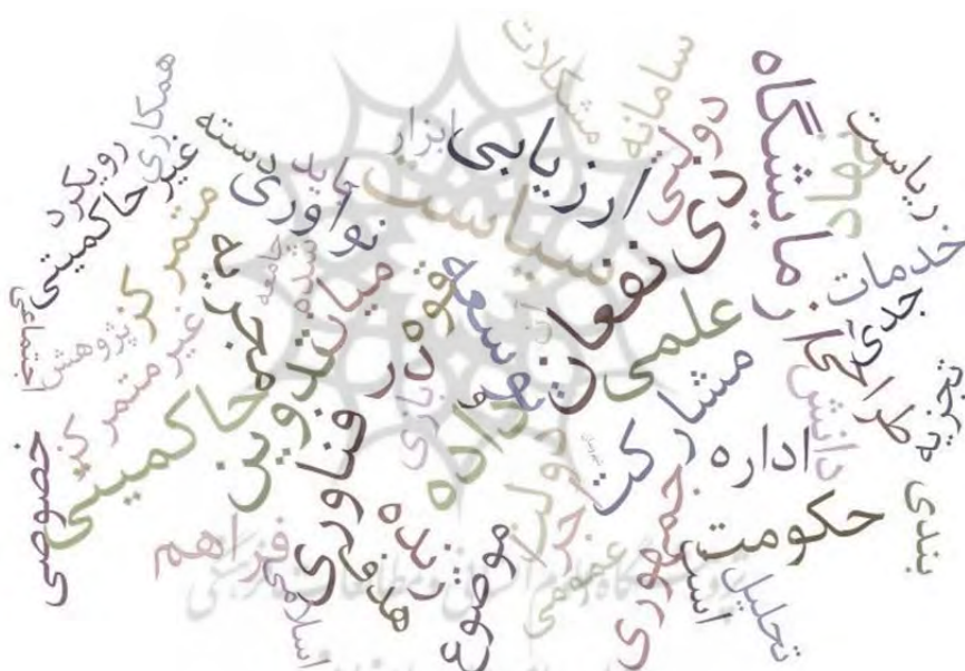
شکل ۲. ابر کلمات، مشتمل بر مجموعه «مصاحبه با خبرگان» درباره آزمایشگاه‌های خط‌مشی

با توجه به ابعاد استخراج شده از ادبیات پژوهش، نتایج زیر از مصاحبه با ۱۶ نفر از خبرگان عرصه خط‌مشی‌گذاری اعم از خبرگان اجرایی و علمی-دانشگاهی حاصل شده‌اند: