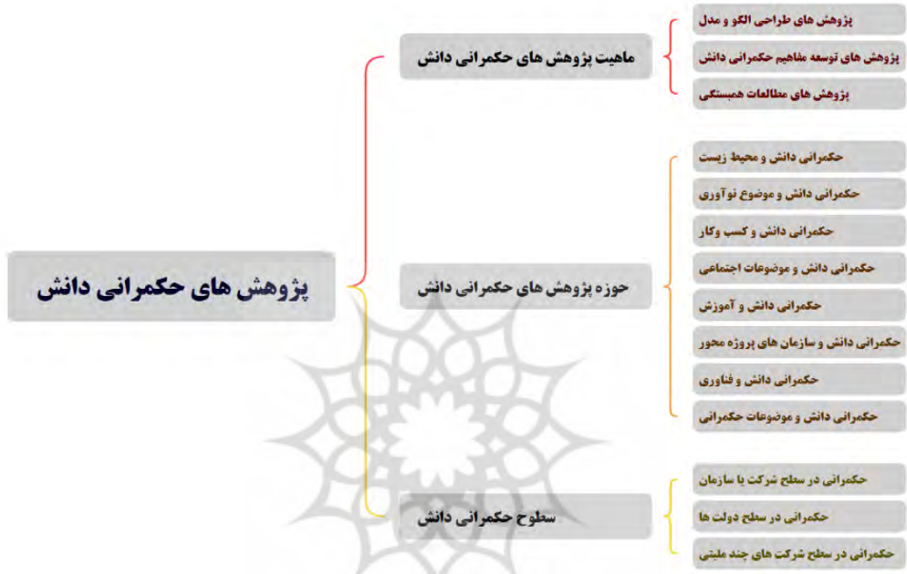
شکل ۳. طبقه‌بندی پژوهش‌های حکمرانی دانش

عمیق‌تری از چالش‌ها و فرصت‌های مربوط فراهم کند. در ادامه، با ارائه درخت‌واره‌ای بصری برای دسته‌بندی و تحلیل پژوهش‌ها، ابزار مفیدی به پژوهشگران ارائه می‌شود تا روابط میان بخش‌های گوناگون حکمرانی دانش را به‌سادگی شناسایی کنند و پیشنهاد می‌شود که این درخت‌واره‌ها برای ارزیابی و تحلیل داده‌های پژوهشی مورد استفاده و گسترش قرار گیرد.