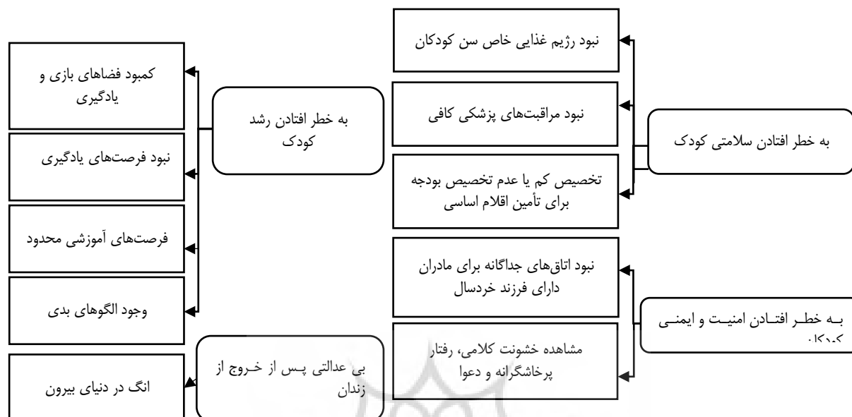
شکل ۱: مهمترین مشکلات شناسایی شده از تحلیل پژوهش‌های پیشین (پژوهشگر)

تفاوت پژوهش حاضر با پژوهش‌های پیشین این است که تمرکز این پژوهش بر ۱. شناسایی حقوق کودکان همراه با مادران زندانی براساس مواد مطرح شده در قوانین و اسناد بین‌المللی و داخلی، ۲. شناسایی مشکلات و نیازهای کودکان همراه با مادران زندانی در طول زندگی در زندان در کشور ایران بوده است.