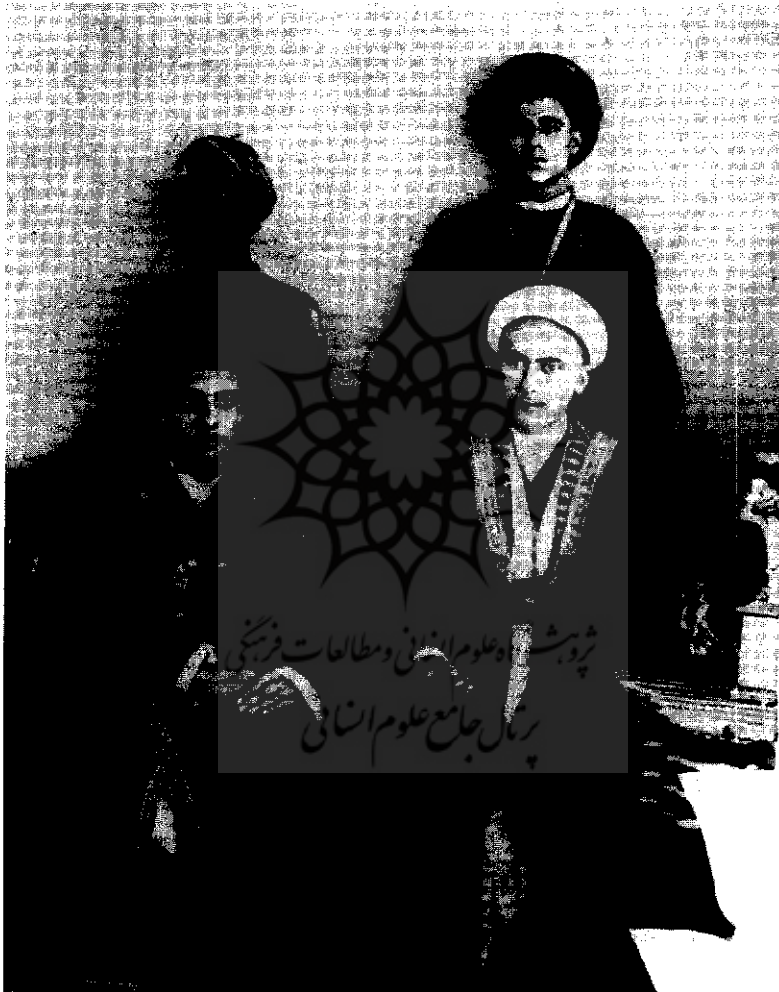
کارکنان کنسولگری عثمانی در بوشهر