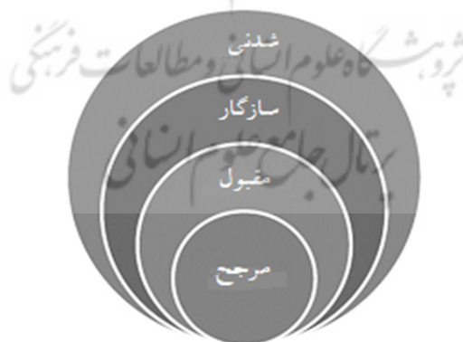
شکل ۳. اخلاق دیجیتال فلوریدی

بنابراین رویکرد فلوریدی، نوعی از درهم‌تنیدگی یا تلفیق اخلاق (سخت و نرم) و معماری (یا کد) فضای مجازی است، زیرا وی معتقد است که اصول اخلاقی، خارج از سیستم قوانین نیستند بلکه بطور ضمنی به صورت جزئی از اجزای قانون، در آن گنجانده شده‌اند. با این توضیح که ابتدا باید بررسی کرد که چه چیز شدنی و ممکن است سپس در این دایره، باید ارزیابی کرد که چه چیز با محیط زیست، سازگار است و سپس اینکه چه چیز از نظر اجتماعی مقبول و در نهایت مرجح است. (شکل ۳) بدین ترتیب قانون از «مجرا»ی اخلاق (و نه اینکه فقط توسط آن) شکل می‌گیرد و مقید می‌شود.