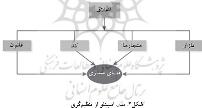
شکل ۲. مدل اسپینلو از تنظیم‌گری

بنابراین اسپینلو گرچه مدل لسیگ را درباره تنظیم‌گرهای چهارگانه، الهام‌بخش می‌داند آن را کافی نمی‌داند و معتقد است که ارزش‌های ذاتی انسانی، مبنایی برای «تعیین حقوق و وظایف اخلاقی» ما انسان‌ها و مبنایی برای «ایجاد قوانین حاکم بر رفتار انسانی» هستند و لذا باید «نقش هدایتگر» و معمارانه در تنظیم‌گری فضای مجازی ایفا کنند. بدین ترتیب در رویکرد اسپینلو، اصول اخلاقی را باید فراتر از چهار تنظیم‌گر مورد نظر لسیگ در نظر گرفت و نه در سطح آنها. یعنی مثلاً معماری (یا کد) فضای مجازی نیز باید مبتنی بر اصول اخلاقی باشد و تحت هدایت آن نوشته شود. (شکل ۲)