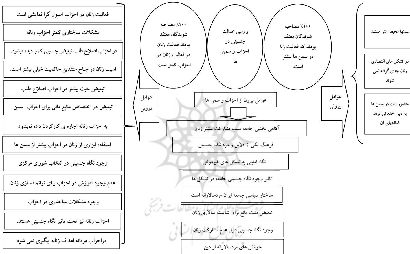
شکل شماره یک ۱، الگوی ترسیم دلایل وجود تبعیض جنسیتی در احزاب و سمن ها