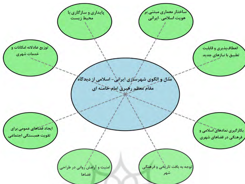
شکل ۲- مدل و الگوی شهرسازی اسلامی از دیدگاه آیت‌الله خامنه‌ای

از دیدگاه آیت‌الله خامنه‌ای، مختصات اسلامی شهرسازی شامل چندین اصل اساسی است که همگی ریشه در آموزه‌های اسلامی و فرهنگ ایرانی دارند. تأکیدات ایشان را می‌توان به شرح زیر خلاصه کرد: