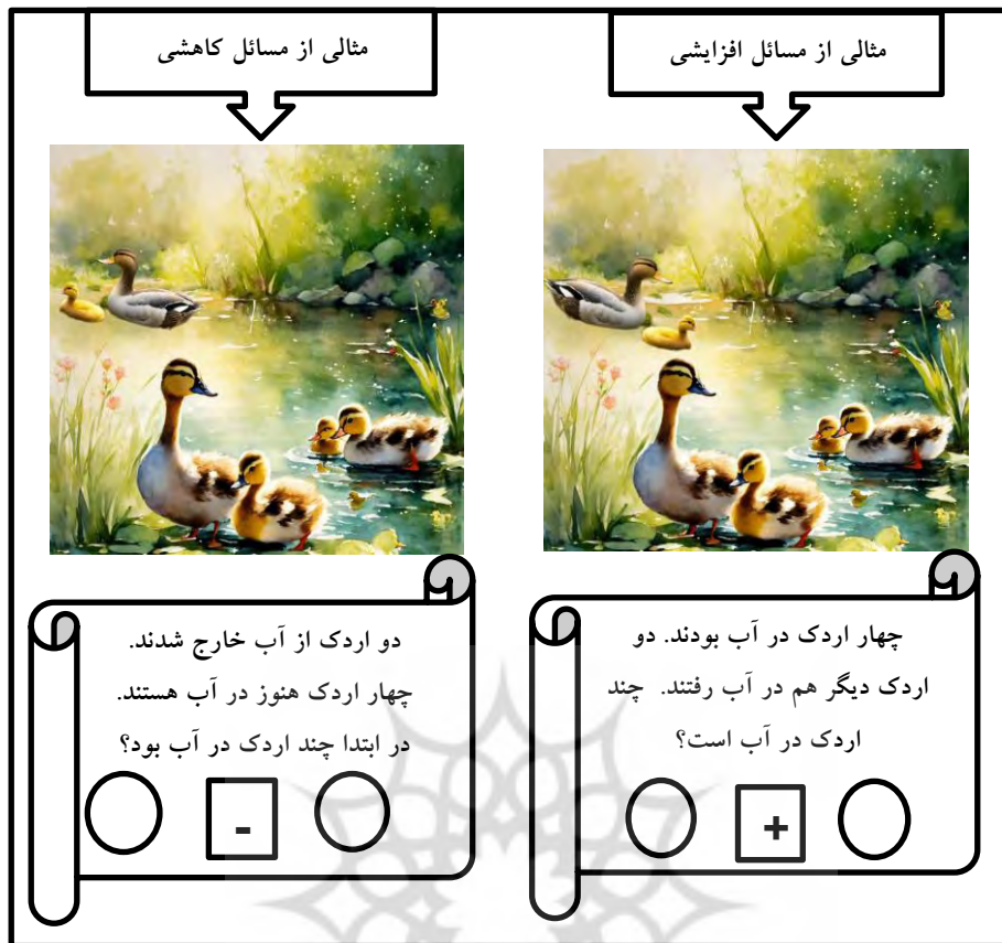
شکل ۱. نمونه مسائل افزایشی و کاهشی با اقتباس از کتاب درسی پایه اول ابتدایی

بنابراین اگرچه در موقعیت کاهشی تصویر نمایش دهنده کاهش است و عبارت عددی با علامت منهای است؛ اما عمل مشترک در واقع جمع محسوب می‌شود؛ نه تفریق. کودکان مسائل ارائه‌شده در قالب تفریق را با استفاده از تفریق مستقیم و مسائل تفریق ارائه‌شده در قالب جمع را با استفاده از روش تفریق توسط جمع حل می‌کنند (Peters et al., 2012). در موقعیت افزایشی شکل ۱ دو تصویر هنوز به هم پیوسته نیستند اما به نظر می‌رسد که باید به هم بپیوندند و این در راستای تکالیف دانش‌آموز است. اما برای موقعیت کاهشی در تصاویر نتیجه جداسازی انجام شده از آنها در مفروق و مقدار اختلاف به وضوح روشن است. یافتن مجهول (مفروق منه) در اینجا به این معناست که باید کودک را از گرایش‌های احتمالی برای در نظر گرفتن علامت منهای به‌عنوان یک دستورالعمل برای تفریق دو مجموعه از یکدیگر که ممکن است منجر به یک پاسخ ناصحیح شود؛ منع کرد. در عوض