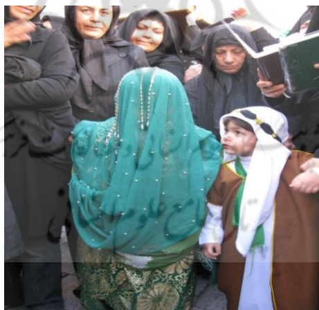
تصویر ۳: کوی دهدشتی؛ بهار ۱۳۹۴

مردم استان بوشهر در هیچ زمانی به‌جز ایام عاشورا راضی به انجام کوچک‌ترین بخشی از این آیین نمایشی نمی‌شوند، اما در این ایام، هر ساله آیین‌گزاران در طول اجرا و پس از آن به شرط باقی حیات تا سال بعد منتظر نتیجه و پاسخ کنش‌های خود به نیت حاجت‌روایی در این مراسم هستند. به باور آن‌ها «روایت‌ها همواره از میانه آغاز می‌شوند، در میانه پیش می‌روند و بخشی از پایان خود را به آینده واگذار می‌کنند» (عارف، ۱۳۹۹، ص. ۱۳۳). به نقل از مارتین (۱۳۸۹). آیین‌گزاران با این فلسفه اجرایی، بر این باورند که برگزاری هر ساله آیین نمایشی حجله قاسم، تداعی معانی حقایق و مستندات صحرای کربلاست.