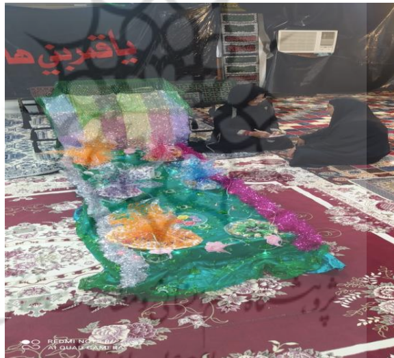
تصویر ۲: کوی جبری؛ تابستان ۱۴۰۲