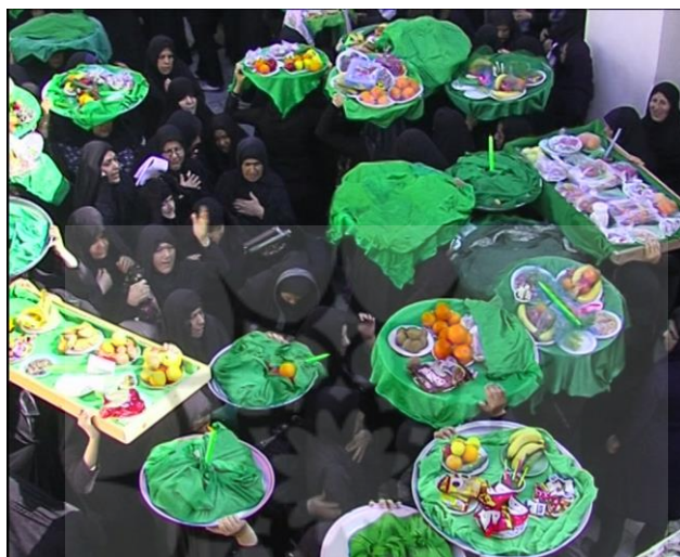
تصویر ۴: کوی دهدشتی؛ بهار ۱۳۹۰ (عکاس نگارنده)

خوانچه‌بران عروس است. تورهای سبز و سیاه گسترده بر خوردنی‌ها بنا بر موقعیت اجرایی جایگزین یکدیگر شده و نشانگر جریان مجلس را از سور به سوی سوگ است. همچنین تور سفید بر سر شبیه عروسی و جایگزین کردن آن با تور سیاه نیز همین کارکرد نمادین را دارد.