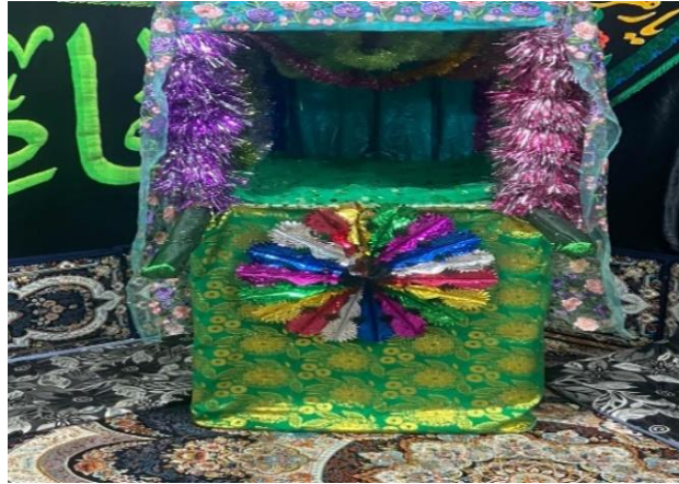
تصویر ۱: کوی جبری؛ تابستان ۱۴۰۲