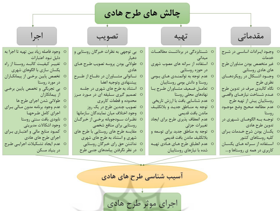
Figure 1. The conceptual model of the research