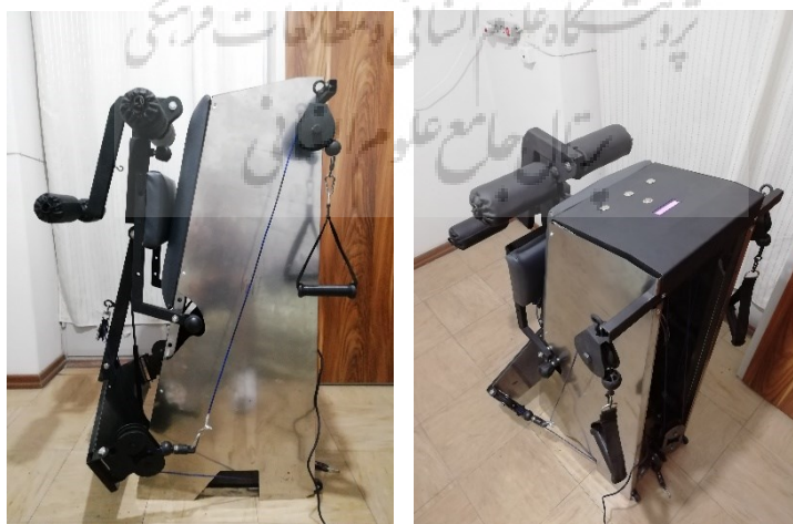
شکل ۲. نمونه اولیه ساخته شده دستگاه (پس از اعمال تغییراتی نسبت به نمونه سه بعدی طراحی شده)

بخش الکترونیکی دستگاه از یک مدار (کدنویسی شده به زبان ++C)، نمایشگر دیجیتال و استپر موتور ساخته شد که در واقع کل این مجموعه، وظیفه محاسبه مقاومت خروجی که توسط کاربر تعیین می شود را دارد. به این صورت که پس از اعمال مقاومت موردنظر به سیستم، استپر موتور دستگاه که درون بخش ثابت مکانیزم نصب شده و موجب به چرخش درآوردن رزوه ۱۲ میلیمتری در مرکز می شود، وضعیت مکانیزم را (با دقت ۰,۵ گیلوگرم) تنظیم می کند. نمایشگر دیجیتال نیز بر روی دستگاه نصب شده و کاربر به راحتی توسط ۳ کلید (افزایش-کاهش-تایید) می تواند به مدار دستور اعمال کند (شکل ۲).