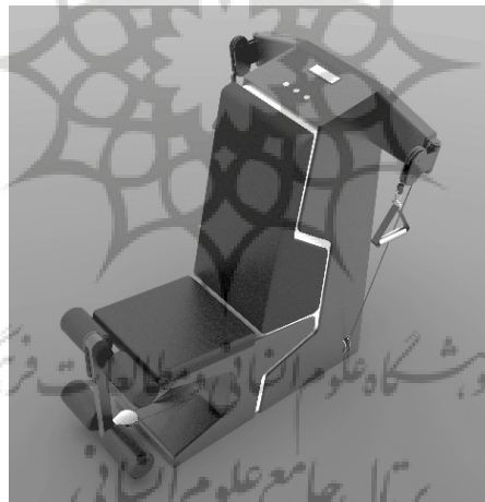
شکل ۱. مدل سه بعدی دستگاه توسط نرم‌افزار راینو

در ابتدا ایده اصلی این دستگاه که همان مکانیزم مکانیکی تغییر گشتاور خروجی بود، پس از انجام محاسبات اولیه بر روی کاغذ، در نرم‌افزار راینو به صورت شماتیک ترسیم شد. سپس با توجه به دامنه تغییرات گشتاور و محاسبه ابعاد و اندازه دقیق اجزای مکانیزم، این قطعات توسط نرم‌افزار اتوکد ترسیم شده و با استفاده از این نقشه‌های دوبعدی و انتقال به نرم‌افزار راینو حجم سه‌بعدی نهایی با دقت مدل‌سازی شد. پس از طراحی مکانیزم، ابعاد اسکلت، بدنه و فرم دستگاه و نشیمنگاه آن با توجه به ابعاد و ارگونومی بدن انسان [۱۴] در نرم‌افزار راینو طراحی و مدل‌سازی شد (شکل ۱).