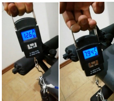
شکل ۵. اندازه گیری مقاومت دستگاه توسط نیرو سنج دیجیتال برای سنجش روایی در مقاومت های ۸ و ۱۲٫۵ کیلوگرم