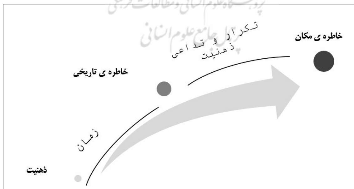
شکل ۱. فرایند شکل‌گیری خاطره و تبدیل فضا به مکان (نگارندگان)