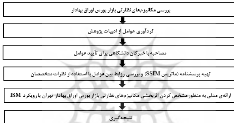
شکل ۱. ساختار روش تحقیق مطالعه با استفاده از روش ISM

نیمه ساختاریافته با گروهی از کارشناسان دانشگاه شهید باهنر کرمان و دانشگاه سیستان و بلوچستان برای تأیید یا حذف عوامل شناسایی شده انجام شد. این کارشناسان شامل اساتید دانشگاهی در گروه حسابداری بودند که به منظور تأیید یا حذف عوامل شناسایی شده انجام شد. انتخاب این کارشناسان به صورت هدفمند انجام شد. تجارب ارزشمند به اشتراک گذاشته شده توسط این کارشناسان در اعتبارسنجی و تأیید عوامل بسیار مهم بود. در ادامه پرسشنامه‌ای طراحی شد و ۲۴ نفر از خبرگان تأثیر عوامل تأیید شده بر یکدیگر را ارزیابی کردند. در نهایت میزان نفوذ و وابستگی هر یک از عوامل تعیین شد. نتایج این فرآیند نمودارهایی است که اهمیت وابستگی‌های متقابل آن‌ها و تأثیر هر عامل بر یکدیگر را نشان می‌دهد. فرآیند تحقیق در شکل ۱ خلاصه شده است.