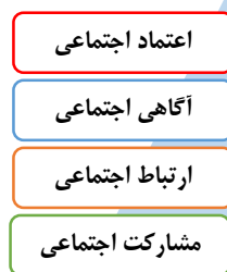
ابعاد سرمایه اجتماعی