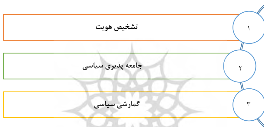
مراحل فرایند جامعه‌پذیری سیاسی از دیدگاه پای و همکاران ۱۳۸۰

عوامل بیرونی (موقعیت و وضعیت اجتماعی، فرهنگی و سیاسی) بر میزان مشارکت افراد موثر است (راوداراد (۱۳۸۳)؛ به نقل از دارا و صادقی، ۱۴۰۱:۳۸۲). پای و همکاران (۱۳۸۰)، جامعه‌پذیری سیاسی را همسو با جامعه‌پذیری به صورت یک فرایند تدریجی در نظر می‌گیرند که از طریق رشد در سه مرحله در افراد نفوذ کرده است. بر این اساس مرحله اول تشخیص هویت است که کودک با فرهنگ جامعه آشنا می‌گردد و از طریق آموزش چگونه عضو شدن در اجتماع را یاد می‌گیرد. این یادگیری به صورت پنهان و آشکار اعمال می‌گردد که نتیجه آن پذیرش هویت خود به عنوان یک عضو از جامعه و اجتماعی شدن است. مرحله دوم جامعه‌پذیری سیاسی است در این مرحله فرد نسبت به جهان سیاسی خود آگاهی یافته و نحوه فهم حوادث سیاسی و قضاوت درباره آن‌ها را کسب می‌کند و به درونی سازی فرهنگ سیاسی پرداخته تا هویت سیاسی به مرحله ظهور برسد. مرحله سوم گمارش سیاسی است که فرد از وضعیت انفعالی به سمت شهروند مشاهده‌گر فعال میل پیدا می‌کند. در مجموع این فرایند به صورت مرحله‌ای از تکامل فرد است که به صورت تدریجی اتفاق می‌افتد تا هویت سیاسی فرد ساخته شود و وارد تعاملات اجتماعی شوند (منتظری و همکاران، ۱۴۰۰:۱۷۸).