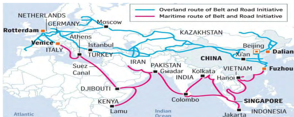
شکل ۱- نقشه ابتکار یک کمربند، یک جاده