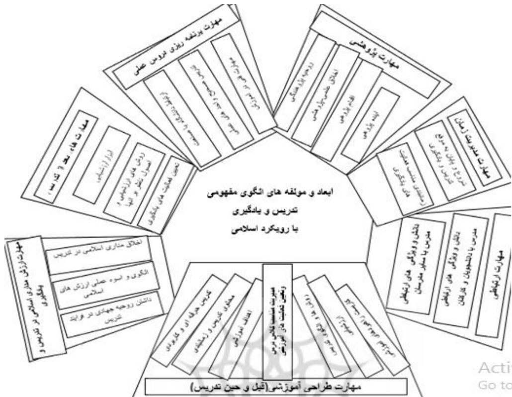
شکل ۱- شکل به دست آمده از بخش کیفی

نسبت به ارزیابی اساتید در اکثر مؤلفه‌ها وجود دارد، که این امر نیاز به بررسی و بهبود روش‌های تدریس و یادگیری در این مراکز را نشان می‌دهد.