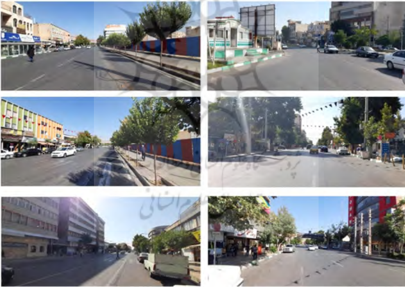
تصویر شماره ۱: موقعیت استان البرز در ایران، موقعیت خیابان شهید بهشتی در استان و تصاویر محدوده مورد مطالعه، ماخذ، نگارنده، ۱۴۰۲