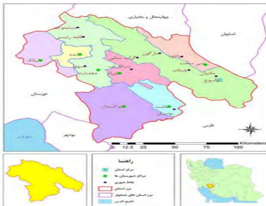
شکل ۱. نقشه تقسیمات سیاسی استان کهگیلویه و بویراحمد