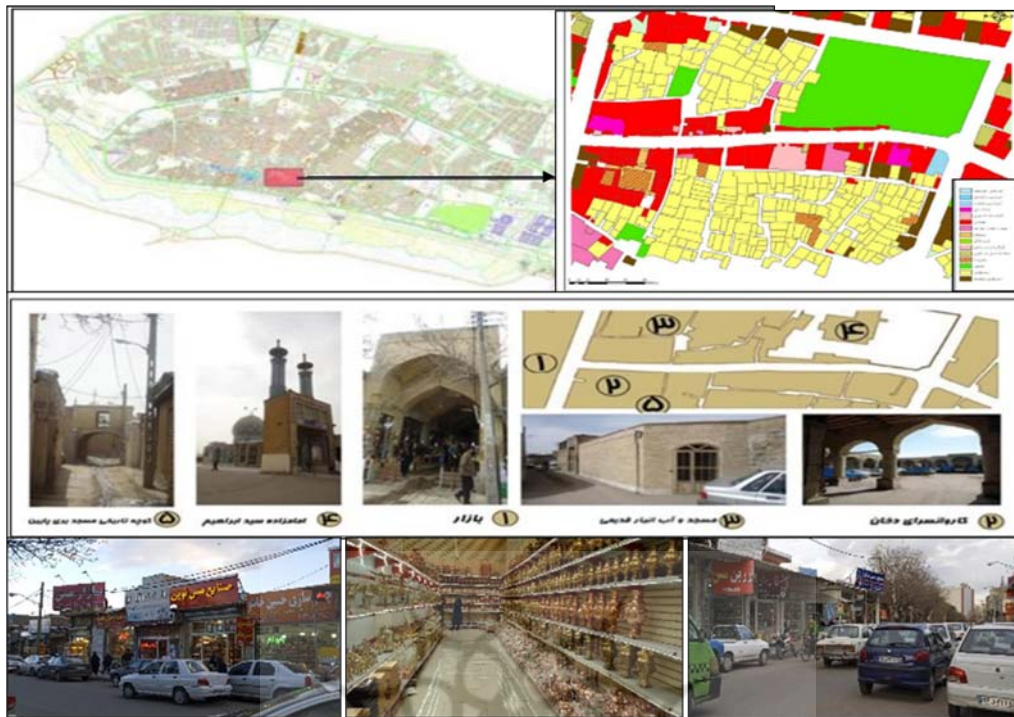
شکل ۲. موقعیت محدوده در شهر زنجان با عناصر مهم تاریخی- هویتی ظروف مسی محور مسگرها

می‌دهد گزینه‌هایی مانند بنای امامزاده، کارگاه‌های مسگری قدیمی، کاروان‌سراها، کارگاه‌های مسگری، کارگاه سفیدگری ظروف مسی، چکش‌زن‌های ظروف مسی، انبارهای ظروف مسی، چاقوسازها، تبر سازها، داس سازها، پالان‌دوزها، باربرهای ظروف مسی، چرخ‌دستی‌های ورودی شهر، بازار تاریخی، کاروان‌سرای دخان، حمام صدیقی اشاره داشتند که هر یک یادآور خاطره‌ای از هویت گذشته هستند. این مقوله نقطه آغازین شناخت مختصات اقتصادی محور است که نشان می‌دهد محور یادشده دارای کدام هویت تاریخی و سنتی بوده و این هویت چگونه شکل‌گیری و بازتجدید صنایع دستی با اهرم مس و مسگری را سبب‌ساز شده است. با نگاهی به گذشته تاریخی شهرها مشاهده می‌شود که عمدتاً بازارهای مرتبط با صنایع دستی در مبادی ورودی و خروجی شهرها و یا در خروجی و ورودی بازارهای اصلی شهر قرار داشته‌اند. مطالعه سازمان فضایی بازار تاریخی شهر زنجان نشان می‌دهد ورودی غربی بازار تاریخی نیز اختصاص به کارگاه‌های مسگری و آهنگری داشته که در حال حاضر تولید و فروش ظروف مسی در آنجا رونق دارد. در مبادی شرقی نیز که خروجی بازار تاریخی زنجان است همین فعالیت در خیابان مسگرها مشاهده می‌شود. هرچند در کنار بازار مسگرها سایر فعالیت مرتبط دیگر مانند چاقوسازی، گیوه‌بافی، گلیم‌بافی، چاروق‌دوزی، ملیله‌کاری و غیره نیز به چشم می‌خورد، ولی آنچه به این محور هویت کالبدی و فعالیت داده هویت مبتنی بر ظروف مسی و مسگری است. با توجه به مباحث مطرح‌شده، مقولات اولیه استخراج‌شده از کدگذاری و رسیدن به مقوله اصلی در جدول ۱ آمده است.