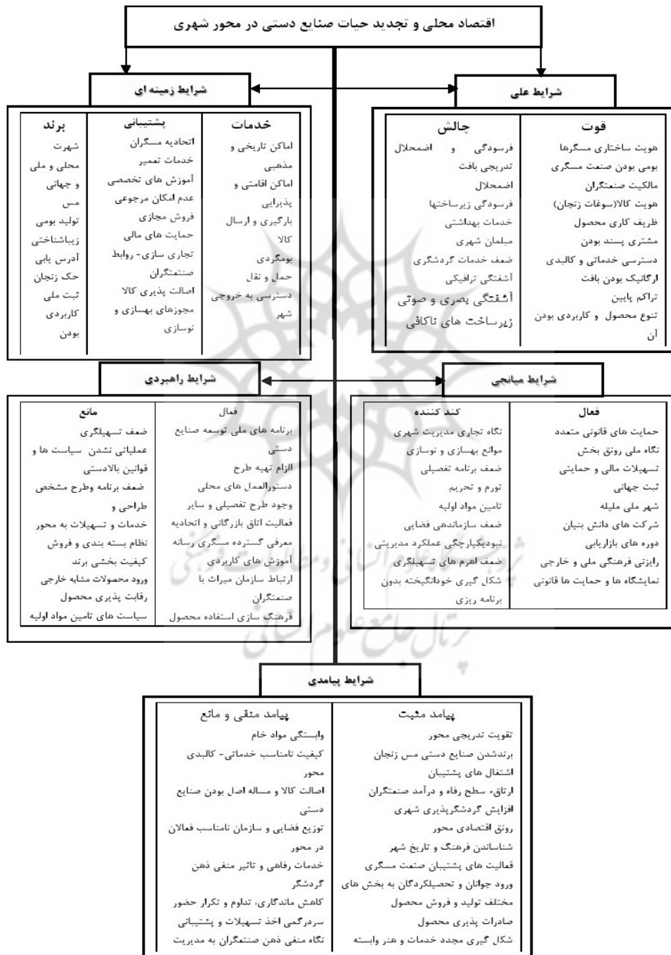
شکل ۳. مدل الگوواره‌های اقتصاد محلی مبتنی بر صنایع دستی در محورهای تاریخی شهر

جریان ترافیکی کنترل نشده، به چالش کشیده شدن برند مس زنجان با توجه به مسئله تشخیص اصالت کالا، سازمان و توزیع فضایی نامناسب فعالان صنایع دستی در طول محور مسگرها، کیفیت نامناسب نمای بناها و آشفتگی بصری آن، کاهش توان رقابت پذیری محصول با توجه به برنامه‌های بازاریابی رقیبان، احساس ناخوشایند گردشگران از کیفیت کالبدی، خدمات رفاهی و تسهیلات عمومی در محور مسگرها و خاطره ذهنی منفی گردشگر، در نتیجه کاهش ماندگاری، تداوم و تکرار حضور. سردرگمی تولیدکننده و فروشنده در