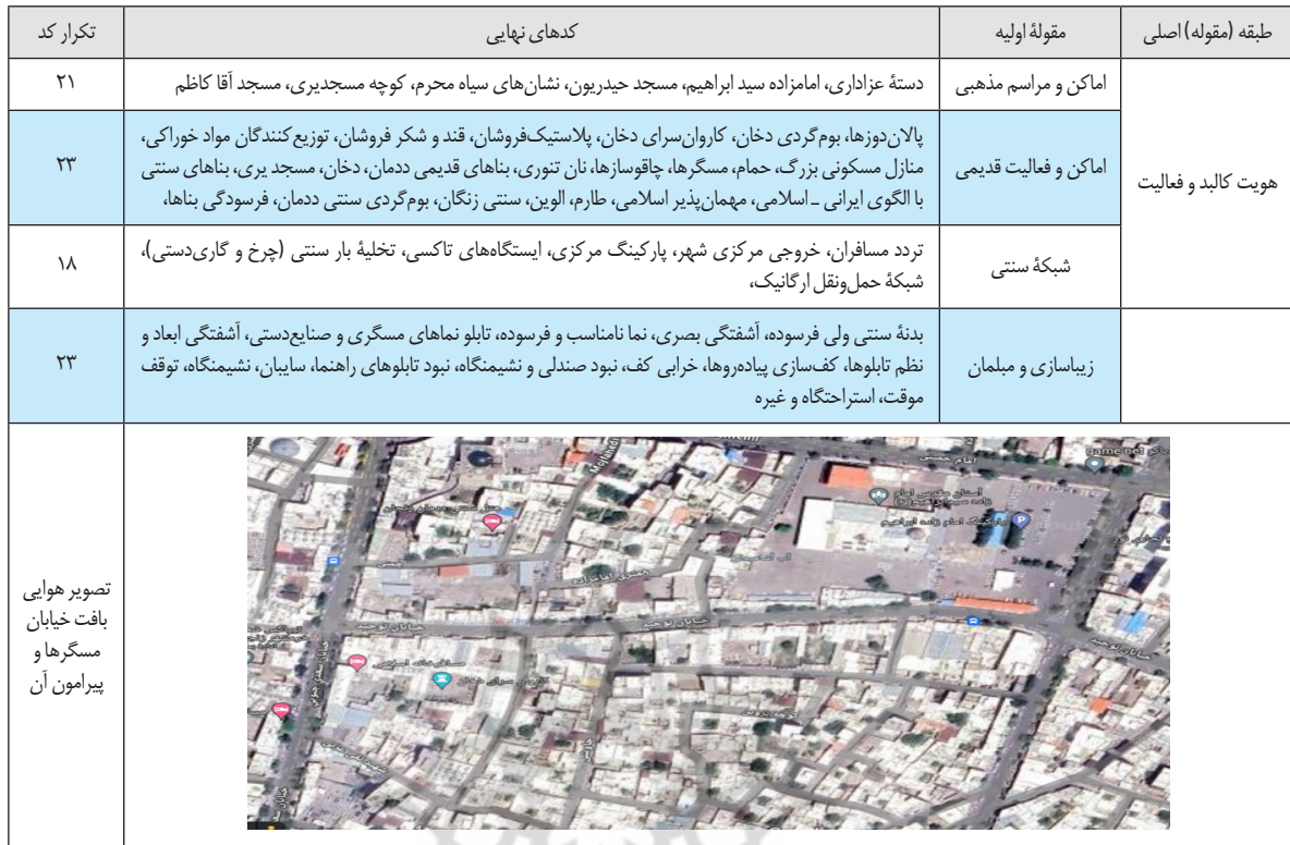
جدول ۱. مقوله هويت كالبد و فعاليت خيابان مسگرها

چالش هایی ریشه در کم توجهی گذشته داشته که اضمحلال محور را سبب ساز شده و فرسودگی آن را تسریع بخشیده است. بخشی از اقتصاد محلی مبتنی بر صنایع دستی در محور یاد شده به کیفیت محیطی برمی گردد که هر چه بالاتر باشد به همان اندازه پویایی کالبد اقتصاد محلی را رونق بخشیده و آن را ارتقا می دهد. ویژگی عناصر و بناهای موجود در محور و پیرامون آن ظرفیتی برای توسعه کالبدی است که توجه به آن ظرفیت اقتصاد محلی را بیشتر شکوفا خواهد کرد. جدول ۲ ظرفیت و چالش های مقوله خدمات و تسهیلات واحدهای صنفی صنایع دستی خيابان مسگرها را نشان می دهد.