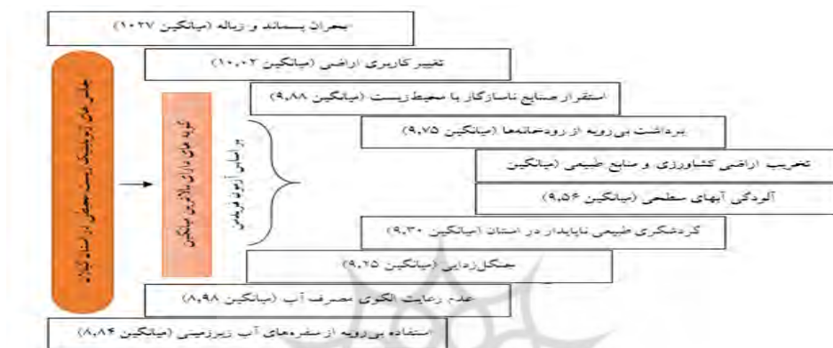
شکل ۱- رتبه‌بندی گویه‌های پرسشنامه و تبیین گویه‌های دارای بالاترین میانگین

بررسی داده‌های گردآوری شده نشان می‌دهد به طور میانگین بیش از ۶۰ درصد از پاسخگویان میزان تأثیرگذاری مجموع گویه‌ها را -در یک نگاه کلی- بر تشدید پیامدهای اقتصادی-اجتماعی ناشی از بحران آب در استان گیلان در سطحی بالا (بسیار زیاد) می‌دانند. همچنین در جدول فوق علاوه بر تشریح نظرات پاسخگویان پیرامون گویه‌های پرسشنامه، رتبه‌بندی این پرسشنامه با بهره‌گیری از آزمون فریدمن و استخراج میانگین هر یک از گویه‌ها نشان داده شده است. نتایج حاصل از رتبه‌بندی گویه‌ها نشان می‌دهد به ترتیب چالش‌هایی همچون بحران پسماند و زباله (میانگین ۱۰۲۷)، تغییر کاربری اراضی (میانگین ۱۰۰۲)، استقرار صنایع ناسازگار با محیط زیست (میانگین ۹۸۸)، برداشت بی‌رویه از رودخانه‌ها (میانگین ۹۷۵)، تخریب اراضی کشاورزی و منابع طبیعی (میانگین ۹۵۶)، آلودگی آب‌های سطحی (میانگین ۹۵۶)، گردشگری طبیعی ناپایدار در استان (میانگین ۹۳۰)، جنگل‌زدایی (میانگین ۹۲۵)، عدم رعایت الگوی مصرف آب (میانگین ۸۹۸) و استفاده بی‌رویه از سفره‌های آب زیرزمینی (میانگین ۸۸۴) اولویت‌های جامعه آماری را تشکیل داده و بیش از سایر گویه‌ها منجر به تشدید پیامدهای اقتصادی-اجتماعی ناشی از بحران آب در استان گیلان می‌شوند.