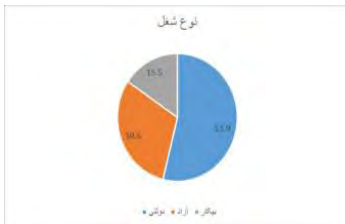
نمودار ۳. وضعیت شغلی جامعه بومی

(نمودار ۲). از بین این افراد، شغل ۳۱/۱٪ آنان بیشترین و ۲۵/۱٪ آنان کمترین میزان وابستگی به گردشگری داشت (نمودار ۳ و ۴).