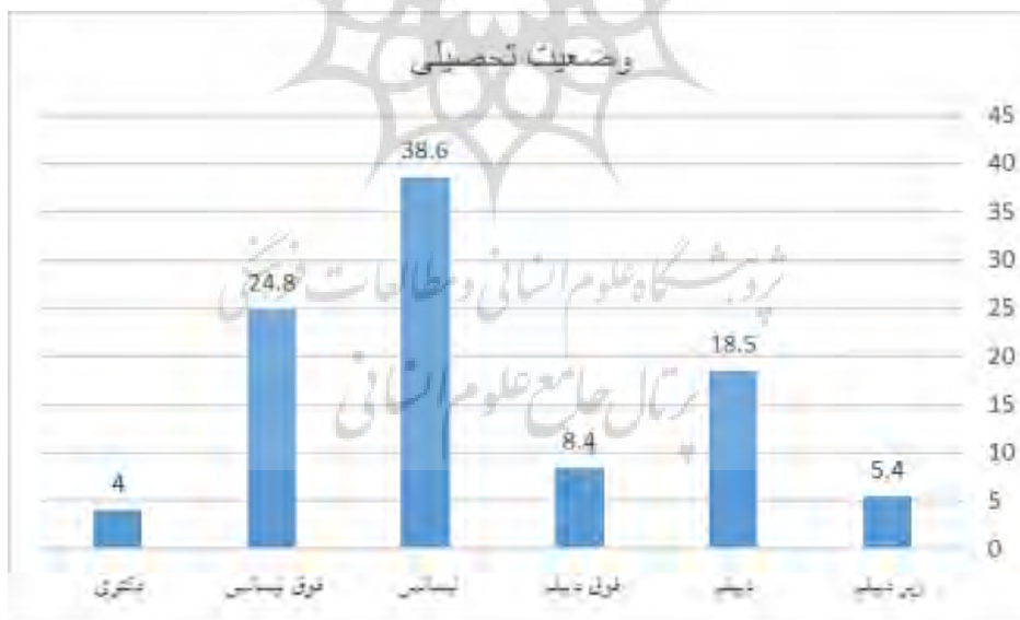
نمودار ۲. توزیع وضعیت تحصیلی جامعه بومی، منبع: نتایج مستخرج از پرسشنامه، ۱۴۰۱

توزیع پاسخ‌دهندگان برحسب وضعیت تحصیلی ارزیابی وضعیت تحصیلی جامعه بومی در ۶ سطح از زیر دیپلم تا دکتری صورت گرفته است. براساس اطلاعات به‌دست آمده از کل