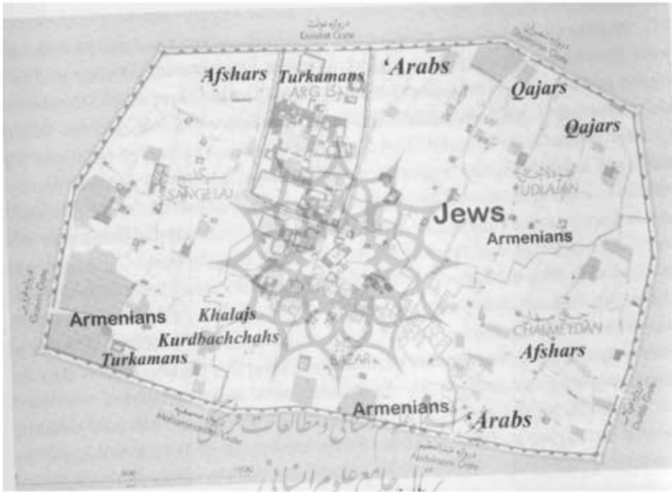
تصویر شماره ۱: محلۀ ارمنی در سنگلج (ر.ک. به: کوندو، ۱۳۹۷: ۱۳۸)

محلۀ سنگلج قرار داشت. راوی ابتدا در مجلس (میدان بهارستان) حضور داشته، سپس به سفارت روسیه رفته و بعد به جاهایی رفته است که نشانی جغرافیایی ندارد. او در آخر شب به محلۀ خودشان «برگشته» و در این برگشت از پارک رد شده بود که بین سفارت روسیه و محلۀ سنگلج قرار دارد، اما اشاره مهم‌تر به این محلۀ «مدرسه ارمنی‌ها» است. نقشه‌ای که از سال ۱۲۷۰ ش/۱۸۹۱ م. باقی مانده، نشان می‌دهد که در سنگلج علاوه بر خانۀ ارمنی‌ها، یک «مدرسه ارمنی‌ها» هم وجود داشته است (تصویر شماره ۱).