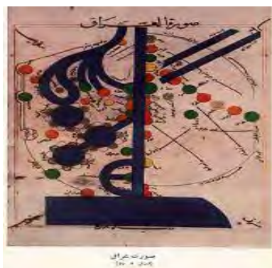
عراق در کتاب مسالک اصطخری

جغرافیای اقتصادی سرزمین عراق، مورد توجه اصطخری و مؤلف اشکال العالم بوده است. مؤلف اشکال العالم در ذکر اوصاف منطقه موصل به درختان و کشاورزی پر آب آن ( اشکال العالم ، ۱۳۶۸: ۹۲). و ذکر اوصاف شهر بصره به خراج آن اشاره می کند ( اشکال العالم ، ۱۳۶۸: ۹۶). اصطخری اشاره ای به این مطالب نداشت؛ اما در ذکر اوصاف شهر سامرا اشاره می کند که میوه های آن بهتر از میوه های بغداد است (اصطخری، ۱۳۴۰: ۸۶).