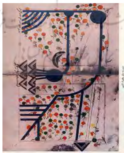
ماوراء النهر در کتاب مسالك اصطخری