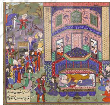
تصویر ۵. سوگ فرود، برگی از شاهنامه شاه طهماسب، متروپولیتن، URL4