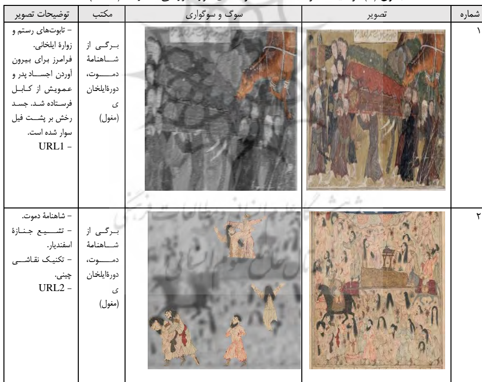
جدول (۱) توضیحات و مشخصات نمونه‌های مورد بررسی، نگارنده (۱۴۰۲)

از بین ۶ نگاره مورد مطالعه، نگاره‌های ۱ و ۲ به مکتب ایلخانی متعلق‌اند که هر دو، مراسم تشییع پیکر را از تصویر می‌کشند. نگاره‌های ۳ و ۴ به مکتب هرات متعلق‌اند که به ترتیب به مرگ اسفندیار و سوگواری بر جنازه اسکندر است. نگاره‌های ۵ و ۶ مربوط به عصر صفوی هستند و به‌طور دقیق‌تر، نگاره ۵ متعلق به مکتب تبریز دوم با عنوان سوگ فرود و نگاره ۶ متعلق به مکتب اصفهان و با عنوان کشته شدن سهراب به‌دست رستم است. در جدول شماره ۱ مشخصات نگاره‌های منتخب ذکر شده است.