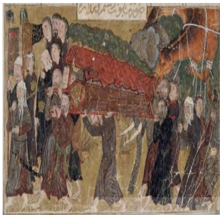
تصویر ۲. نگاره تشیع جنازه اسفندیار، برگی از شاهنامه دموت، تیموری URL2