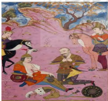
تصویر ۶. کشته‌شدن سهراب به‌دست رستم، اثر معین مصور، صفوی، لندن، موزه بریتانیا URL5

کلاه رستم، کلاه‌بست کله پلنگی با روایتی به نام گورانی هفت خان رستم. در این روایت پس از آنکه رستم سر دیو سپید را از تن جدا می‌کند به گودرز می‌گوید کله دیو سپید را خالی کند و پوست را از کله بیرون کشد تا در روز جنگ آن را بر سر بگذارد و کله دیو سپید خلعتی برای سرش باشد تا همه بدانند که او کشنده دیو سپید است (اکبری مفاخر، ۱۳۹۵: ۲۵۰-۲۵۱). به‌جز رستم که از شدت غم کلاه از سر خود انداخته است، سه پیکره دیگر کلاه به‌سر دارند. زاویه دید از روبه‌روست و پیکره که در طرف تصویر به‌صورت قرینه روی اسب‌اند به‌نشانه تحیر انگشت بر دهان دارند. دشت ساده و بدون تزیینات بیشترین فضا را مشغول کرده است. در یک‌سوم بالایی نگاره، آسمان آبی با ابرهای سفید پیچان مشاهده می‌شود. رنگ‌بندی در این تصویر به‌صورت محدود بوده و تنوع رنگی در فضای طبیعت بسیار کم است، اما در پوشش‌ها پذیرفتنی است. تکرار رنگ نارنجی و قرمز به‌همراه ترکیب‌بندی باعث گردش چشم می‌شود. نگارگر هنگام ترسیم این نگاره به‌تناسبات طلایی و قرینگی دقت ویژه‌ای داشته است. در جدول شماره ۲ بر اساس تحلیل‌های فوق، نمود آداب سوگواری و مناسک آن در نگاره‌های منتخب ذکر شده است.