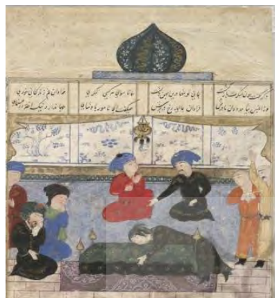
تصویر ۴. نگاره سوگواری مادر اسکندر بر جنازه وی، موزه هنری هاروارد، شماره ۱۹۳۶، ۲۹

یکسان انجام شده است. فضای کلی به صورت ساده و بدون تزیینات و جزئیات است. در به تصویر کشیدن فضای حزن انگیز موفق بوده و به خوبی مضمون داستان را منتقل نموده است.