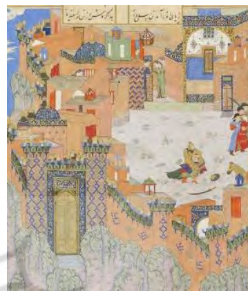
تصویر ۳. نگاره مرگ اسفندیار، برگی از شاهنامه منسوب به محمد جوکی، لندن، انجمن سلطنتی آسیایی URL3

نگاره پنجم: سوگ فرود ۱ ، این نگاره، برگی از شاهنامه شاه طهماسب منسوب به میرزا محمد قبهات و عبدالعزیز است. نقاشان، سوگ ایرانیان را بر سرنوشت غم‌انگیز فرود، پسر سیاوش و جریره به تصویر کشیده‌اند. جریره پس از مشاهده مرگ پسرش، شکمش را با خنجر باز کرد، در حالی که صورتش در کنار فرود گذاشته بود، اجازه داد بمیرد. یکی از پراحساس‌ترین صحنه‌ها در تمام نسخه است. زنان موهای خود را بیرون می‌کشند و گریه می‌کنند، درباریان با ناامیدی به سرشان می‌کوبیدند، در حالی که چین‌خوردگی در چهره‌شان حکایت از شفقت شدید دارد. در تصویر، ۳۰ پیکره مشاهده می‌شود و زاویه دید از روبه‌روست و بخشی از تصویر داخل ایوان است. بانوان از داخل ایوان و از پشت پنجره نظاره‌گر این واقعه‌اند. تنوع رنگی زیاد در پوشش‌ها با رنگ‌های تند و گرم و استفاده زیاد از لاجورد، به‌ویژه در ترسیم بنا مشاهده می‌شود که با تکرار این رنگ در پوشش‌ها باعث گردش چشم می‌گردد. در راست تصویر در کنار تخت‌گاه، مردی نشسته با دستمالی سفید در حال پاک کردن اشک‌های خود است. دو مرد دیگر که در اطراف وی هستند به صورت نشسته تصویر شده‌اند با این تفاوت که سرهایشان برهنه است. تجمع