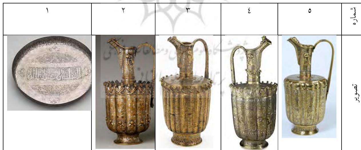
جدول ۱- ظروف فلزی دوره سلجوقی

این ظروف فلزی دسته‌دار که دارای تزیین گیاهی به همراه خوش‌نویسی با خط کوفی و نسخ است، دارای تزیینات جانوری به سبک ساسانی می‌باشند. بر روی همه ظروف فلزی این دوره کتیبه وجود دارد؛ اغلب نام هنرمند و مشتری بر روی ظروف حکاکی شده است (جودی، ۱۳۹۶: ۵۷). محتوای کتیبه‌های کوفی در دوره سلجوقی، در بیان دعای خیر و استعانت بوده و به ندرت نام سازنده ظرف را دربرداشته‌اند (قاسمی قاسموند و شکرانی فرد، ۱۳۹۸: ۴۵). در جدول (۱) ظروف فلزی دوره سلجوقی، شامل یک سینی و نه عدد ابرق همراه با شناسنامه اثر که از موزه استخراج شده و جزئیات تصویر و بخش کتیبه‌دار ظرف به همراه آنالیز خطی آن مشاهده می‌شود.