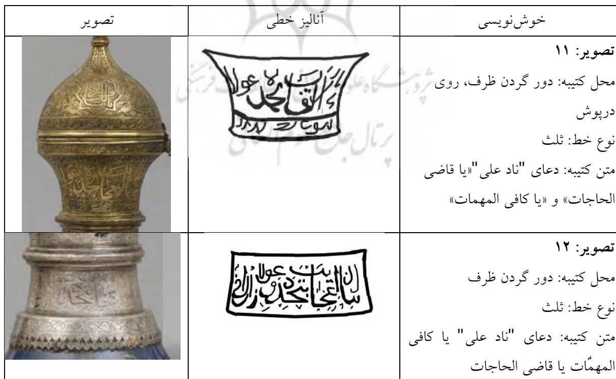
جدول ۴- آنالیز خطوط خوش‌نویسی ظروف فلزی دوره صفوی (نگارندگان)

دوره صفوی به علل سیاسی، اقتصادی، اجتماعی و مذهبی دوره تحولات بارز و ارتباطات ویژه تجاری بود و این تحولات، خود بستر لازم برای تغییرات لازم در جهت تغییر در رویداد را درباره آداب و رسوم و شعائر مذهبی، هم در طبقه حاکم و تأثیرگذار و هم در طبقه عوام و تأثیرپذیر، ایجاد نمود (عموئیان و همکاران، ۱۴۰۰: ۱۳۸). جدول شماره (۴) آنالیز خطوط خوش‌نویسی ظروف فلزی دوره صفوی است.