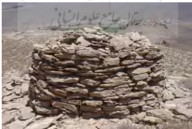
شکل ۱۰. نمونه‌ای از گورهای سنگ‌چین (استوانه‌ای) بردسیر، دید از شرق (برگرفته از خسروززاده، ۱۳۸۶)

مشابه گورهای سنگ‌چین جنوب غرب، از مناطق مختلف ایران به‌خصوص جنوب شرق نیز گزارش شده است. نمونه‌های گورهای پشته‌سنگی استوانه‌ای در جنوب شرق به شکل بیضی یا دایره‌ای است که با استفاده از سنگ‌های لاشه بدون ملاط و به شکل خشکه‌چین ساخته شده‌اند. در نمونه‌های جیرفت گاهی رج‌های اول و دوم با ملاط گل و رج‌های بعدی به شکل خشکه‌چین ساخته می‌شود. این شیوه در گورستان قلعه‌چشمی بردسیر نیز دیده می‌شود (خسروززاده، ۱۳۸۶، ص. ۸۹). در نمونه‌هایی که تقریباً سالم باقی مانده، به نظر می‌رسد که سقفی قوسی‌شکل داشته‌اند. این قوس سقف در گورستان فرهادی و دمب‌کوه با استفاده از سنگ‌های تخت و بدون ملاط ایجاد شده است. در نمونه‌های بردسیر این گورها معمولاً پنجره‌ای به ابعاد ۵۰×۵۰ سانتیمتر و ورودی کوچکی به بلندی ۵۰ سانتیمتر نیز دارند. بلندی دیوار سنگ‌چین این گورها گاهی بیش از ۲ متر و قطر این گورها نیز به ۲ متر می‌رسد (شکل ۱۰). در بررسی جزیره قشم نیز گورهای سنگ‌چینی مشابه با گورهای پیش‌گفته شناسایی شده است (Khosrowzadeh et al., 2017).