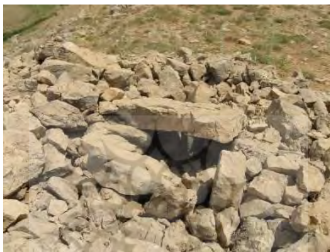
شکل ۶: نمونه‌ای از گورهای سنگ‌چین چهاردول (FS 47)؛ دید از جنوب غرب

غربی - جنوب شرقی است و شمار ۱۴ چُل (گور سنگی) بر ستیغ آن دیده می‌شود. در قسمت شرقی کوه دشت جونقان و گوشه و در سوی غرب و جنوب آن دره دراشکفت قرار دارند. شیب کوه از جهت شرق و غرب نسبتاً تند است و از سوی شمال و جنوب شیب نسبتاً ملایمی دارد. گورهای سنگی به شکل خطی در امتداد شمالی - جنوبی، بر بستر صخره‌ای ایجاد شده‌اند (شکل ۶). تمامی این گورهای سنگ‌چین حفاری غیر مجاز شده و سازه اصلی آن‌ها از بین رفته است. در چند گور که سالم‌تر باقی مانده‌اند، اثر چاله‌های گور "فضاهای ایجاد شده برای قرار دادن جسد" به خوبی دیده می‌شود که از این نظر مشابه گورهای سنگ‌چین بخش غربی سراب بکان هستند. بزرگ‌ترین گور سنگ‌چین ۲۰×۲۰ متر و کوچک‌ترین آن‌ها ۵×۵ متر مساحت دارند (همان، ص. ۲۱۹).