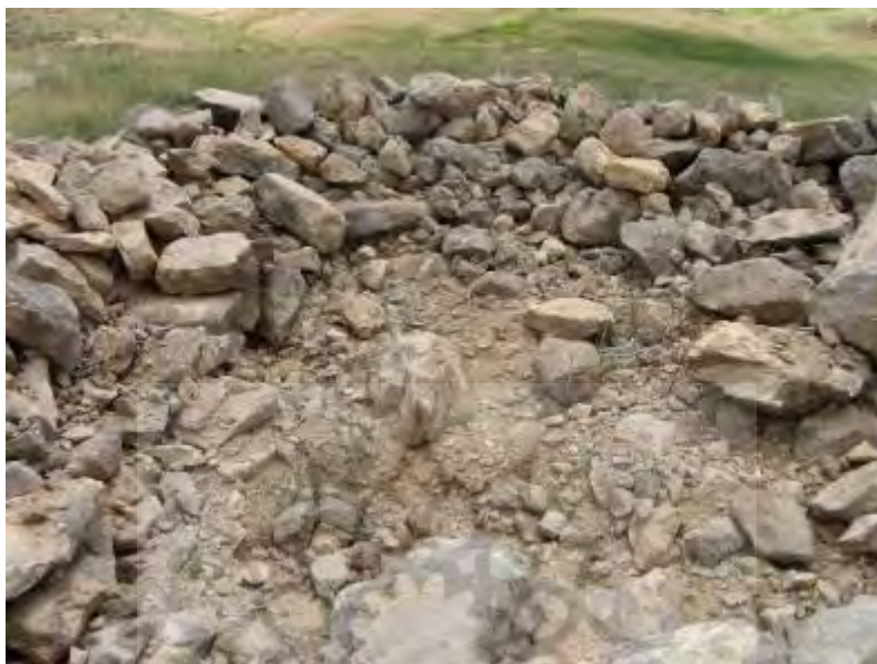
شکل ۳: نمونه‌ای از گورهای سنگ‌چین بخش شرقی دره سراب بکان (FS 5)؛ دید از شمال شرق (برگرفته از

شده است. در بزرگ‌ترین گور شناسایی شده که در بلندترین نقطه نیز قرار دارد، ۸ فضای چهارگوش دیده می‌شود. این ۸ فضا در دو ردیف ۴ تایی است که به وسیله دیواری سنگ‌چین از هم جدا می‌شوند. خود فضاها نیز با استفاده از سنگ‌های لاشه کوچک و بزرگ در سه یا چهار رج، به ارتفاع ۵۰ تا ۶۰ سانتیمتر ایجاد و روی هر فضا به وسیله سنگ‌های تخت و بزرگ پوشانده می‌شد. طول این تخته‌سنگ‌ها گاه به دو متر می‌رسد. فضاهای چهارگوش به طول ۲/۴۰ و عرض ۵۰ سانتیمتر هستند (همان، صص. ۲۱۷-۲۱۶).