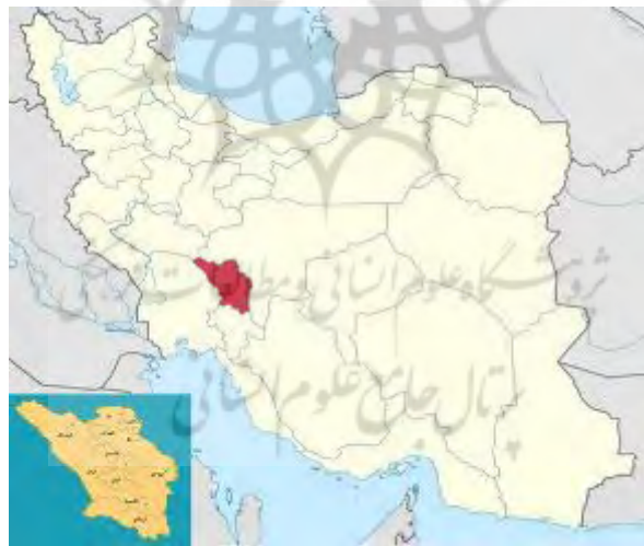
شکل ۱: نقشه موقعیت شهرستان فارسان در استان چهارمحال و بختیاری و ایران (برگرفته از: خسروزاده، ۱۳۹۳)

از نظر زمین‌ریخت‌شناسی این منطقه ترکیبی است از کوه‌های بلند، دره‌های عمیق و دشت‌های آبرفتی، که امکان کاربری‌های متنوعی از زمین را فراهم کرده است. شهرستان فارسان به جهت محدودیت وسعت، طولانی بودن فصل سرما و فراوانی تعداد روزهای یخبندان طبیعتاً تنوع چندان زیاد گونه‌های گیاهی ندارد. بر این اساس، گونه جنگلی قابل ذکری در محدوده شهرستان وجود ندارد و بیشتر محدود به باغ‌ها، کشت‌های زراعی و گونه‌های مرتعی از جمله انواع گون است (خسروزاده، ۱۳۹۳، صص. ۱۲-۱۴).