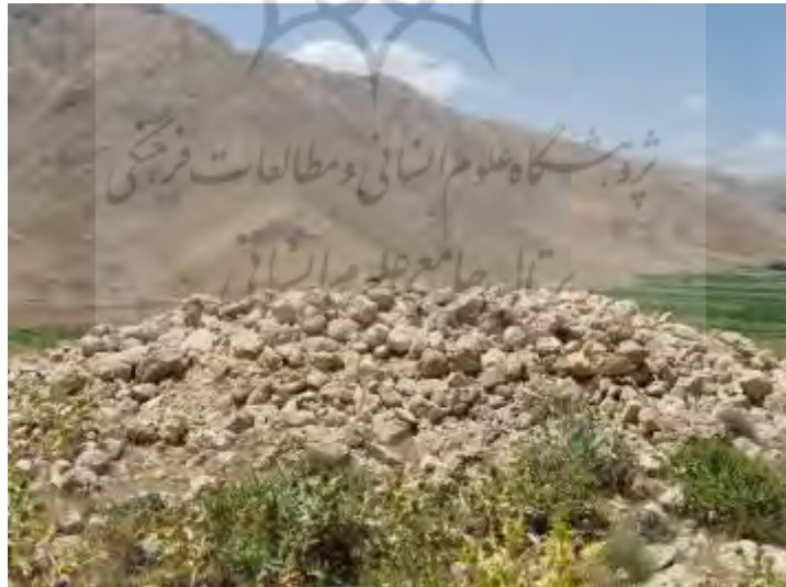
شکل ۵: نمونه‌ای از گورهای سنگ‌چین می‌زرداشتی (FS 34)؛ دید از جنوب غرب (برگرفته از خسروززاده، ۱۳۸۶)

چل‌های می‌زرداشتی (FS 34) نیز به شکل پشته‌سنگی استوانه‌ای هستند. این گورها بر دامنهٔ شمالی کوه مومیایی بر سطح محوطهٔ می‌زرداشتی ۲ قرار گرفته است. یکی از گورها کاملاً نابود شده و فقط سنگ‌های سطح آن باقی مانده است. گور دیگر که دیواره‌های آن سالم است، حفاری غیر مجاز شده که چند تکه سفال بر سطح محوطه نیز احتمالاً مربوط به این گور است. گور همانند سایر گورها به شکل بیضی است که بیش از ۱/۵ متر از بلندی آن باقی مانده است. قطر گور ۷ متر است (شکل ۵). از نظر ریخت‌شناسی این گور مشابه به گورهای کوه آل‌ماقاجی است (همان، ص. ۲۱۷).