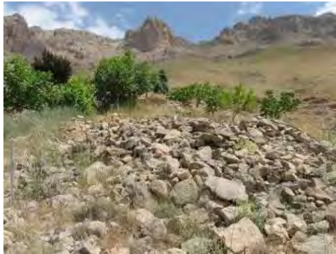
شکل ۴: نمونه‌ای از گورهای سنگ‌چین بخش غربی درهٔ سراب بکان (FS 73)؛ دید از جنوب (برگرفته از خسروززاده،