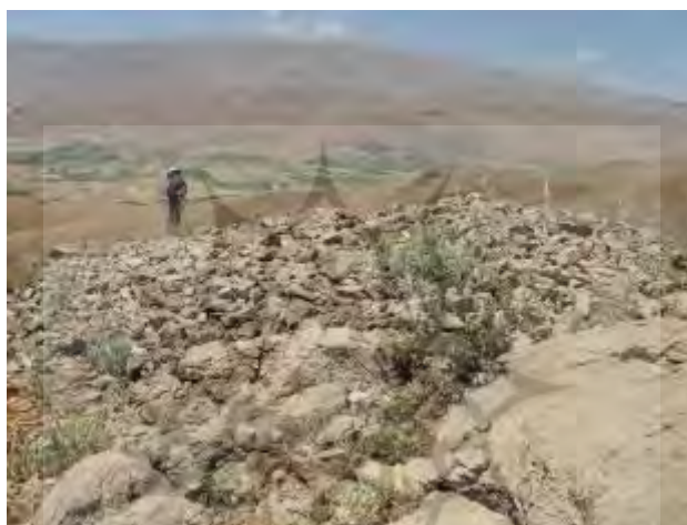
شکل ۱۱. نمونه‌ای از گورهای سنگ‌چین دره حنا (FS 142)؛ دید از شرق (برگرفته از خسروزاده، ۱۳۹۳)

این گورها نیز بر بستر صخره‌ای یا خاکی ایجاد شده‌اند (خسروزاده، ۱۳۹۳، صص. ۲۱۵-۲۱۶). از جمله گورهای پشته‌سنگی ساده شناسایی شده در فارسان می‌توان به موارد زیر اشاره کرد: چُل‌های دره حنا (FS 140, FS 141, FS 142, FS 143, FS 144). این گورستان در فاصله ۳/۴ کیلومتری شمال فارسان، در دره حنا بالا قرار گرفته است. شمار ۷ گور بر ستیغ کوه مشرف به دره حنا و شهر فارسان به شکل خطی در جهت شرق به غرب دیده می‌شود. غربی‌ترین گور که بزرگ‌ترین آن‌ها با ۸ متر قطر نیز هست، در بلندترین نقطه قرار گرفته است (شکل ۱۱). کوچک‌ترین گور حدود ۵ متر قطر دارد. تمامی گورها تخریب شده و شکل اصلی‌شان از بین رفته و مواد فرهنگی نیز از سطح و اطراف آن‌ها به دست نیامد. از نظر شکل و ساختار مشابه سایر گورهای سنگی منطقه فارسان، به شکل پشته‌های سنگی گرد یا بیضی هستند (همان، ص. ۲۲۱).