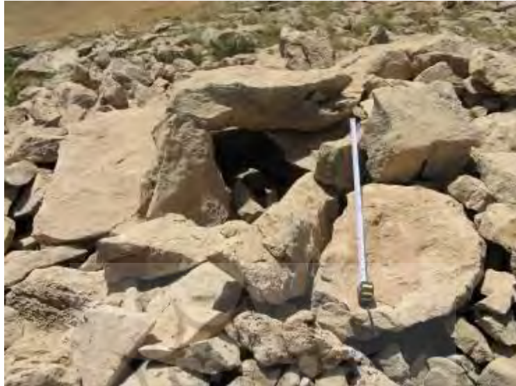
شکل ۷: نمونه‌ای از گورهای سنگ‌چین کوه آل‌ماقاجی (FS 82)؛ دید از شمال

پر کرده‌اند. ساختار این گورها تقریباً مشابه به گورهای شرق درهٔ سراب بکان است و در هر گور معمولاً چند تدفین انجام می‌شده است. در هیچ‌یک از گورها بقایای تدفین دیده نشده و با این که بیشتر گورها حفاری غیر مجاز شده‌اند، ولی تنها یک قطعه سفال از سطح این گورستان به دست آمد. این گورها در دوره‌های گذشته مورد دستبرد قرار گرفته‌اند (همان، ص. ۲۲۰).