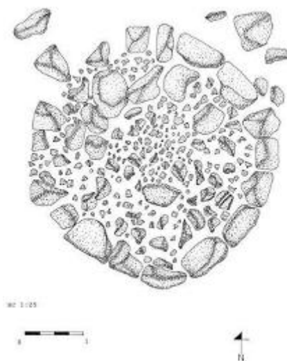
شکل ۹. طرح گور سنگ‌چین تنگ بلاغی (برگرفته از جعفری، ۱۳۹۲، ص. ۱۵۰)

مشابه گورهای سنگ‌چین جنوب غرب، از مناطق مختلف ایران به‌خصوص جنوب شرق نیز گزارش شده است. نمونه‌های گورهای پشته‌سنگی استوانه‌ای در جنوب شرق به شکل بیضی یا دایره‌ای است که با استفاده از سنگ‌های لاشه بدون ملاط و به شکل خشکه‌چین ساخته شده‌اند. در نمونه‌های جیرفت گاهی رج‌های اول و دوم با ملاط گل و رج‌های بعدی به شکل خشکه‌چین ساخته می‌شود. این شیوه در گورستان قلعه‌چشمی بردسیر نیز دیده می‌شود (خسروززاده، ۱۳۸۶، ص. ۸۹). در نمونه‌هایی که تقریباً سالم باقی مانده، به نظر می‌رسد که سقفی قوسی‌شکل داشته‌اند. این قوس سقف در گورستان فرهادی و دمب‌کوه با استفاده از سنگ‌های تخت و بدون ملاط ایجاد شده است. در نمونه‌های بردسیر این گورها معمولاً پنجره‌ای به ابعاد ۵۰×۵۰ سانتیمتر و ورودی کوچکی به بلندی ۵۰ سانتیمتر نیز دارند. بلندی دیوار سنگ‌چین این گورها گاهی بیش از ۲ متر و قطر این گورها نیز به ۲ متر می‌رسد (شکل ۱۰). در بررسی جزیره قشم نیز گورهای سنگ‌چینی مشابه با گورهای پیش‌گفته شناسایی شده است (Khosrowzadeh et al., 2017).