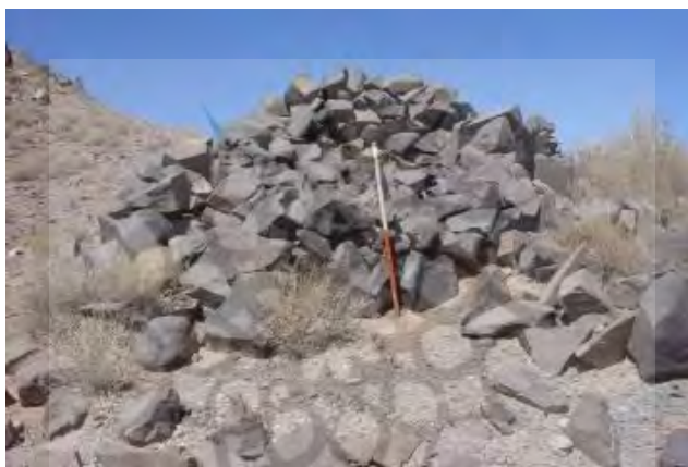
شکل ۱۴. نمونه‌ای از گورهای سنگ‌چین (پشته‌سنگی) بردسیر، دید از جنوب (برگرفته از خسروزاده، ۱۳۸۳).

مشابه گورهای پشته‌سنگی ساده در جنوب شرق نیز گزارش شده است که این‌گونه گورها به شکل دایره یا بیضی، در ابعاد کوچک و بزرگ‌اند که قطر آن‌ها گاهی به ۱۵ متر می‌رسد. این‌گونه گورها با استفاده از سنگ‌های لاشه و تخت به شکل پشته‌سنگ‌های بیضی، دایره و گاهی چهارگوش ایجاد شده‌اند. چنین گورهایی در منطقه جنوب شرق فراوان است که می‌توان به سرآسیاب کرمان، جیرفت، بافت، بردسیر، منطقه بختیاری، حاجی‌آباد هرمزگان، میناب به عنوان مناطقی که این نوع گورها از آن به دست آمده است، اشاره کرد (خسروزاده، ۱۳۸۶، صص. ۹۰-۹۱) (شکل ۱۴).