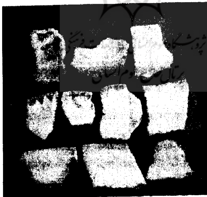
تصویر ۱: قطعات سفالی از محوطه قوشاتپه