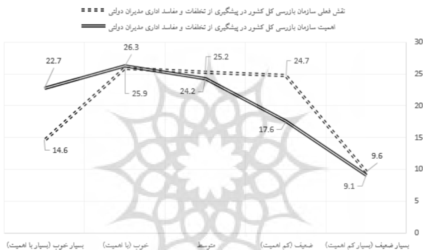
نمودار (۱) توزیع درصدی میانگین کل نگرش پاسخگویان درباره نقش فعلی و اهمیت سازمان بازرسی کل کشور در پیشگیری از تخلفات و مفاسد اداری مدیران دولتی

توصیف گویه‌های وضعیت فعلی نقش سازمان بازرسی در پیشگیری از تخلفات و مفاسد اداری مدیران دولتی، نشان داد که اندکی بیش از ۲۵ درصد پاسخگویان در طیف متوسط (بینابین)، حدود ۳۴/۵ درصد در طیف «ضعیف و بسیار ضعیف» و ۴۰/۵ درصد در طیف «خوب یا بسیار خوب» قرار دارند. بر اساس آن یافته‌ها، می‌توان نتیجه گرفت که پاسخگویان نقش فعلی سازمان بازرسی کل کشور در پیشگیری از تخلفات و مفاسد اداری مدیران دولتی را در حد متوسط و متمایل به خوب ارزیابی می‌کنند.